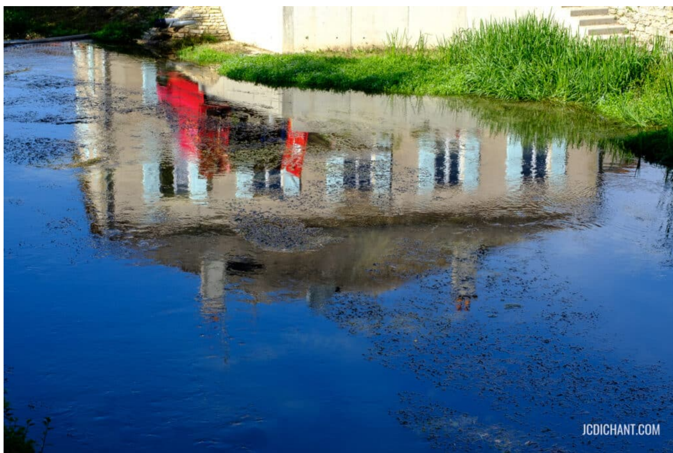
Renversant, en Meuse

Trouver l'inspiration n'est jamais que faire le tour de ce que vous aimez, de ce que vous ressentez, de ce que vous avez envie de montrer. C'est de là que naît l'émotion.