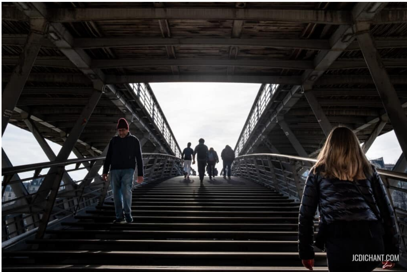
Sous les ponts de Paris