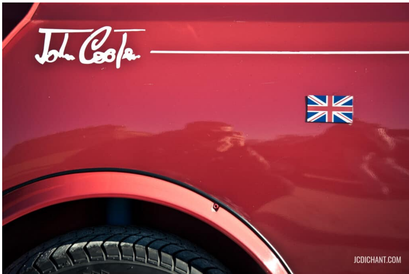
Austin Mini Cooper