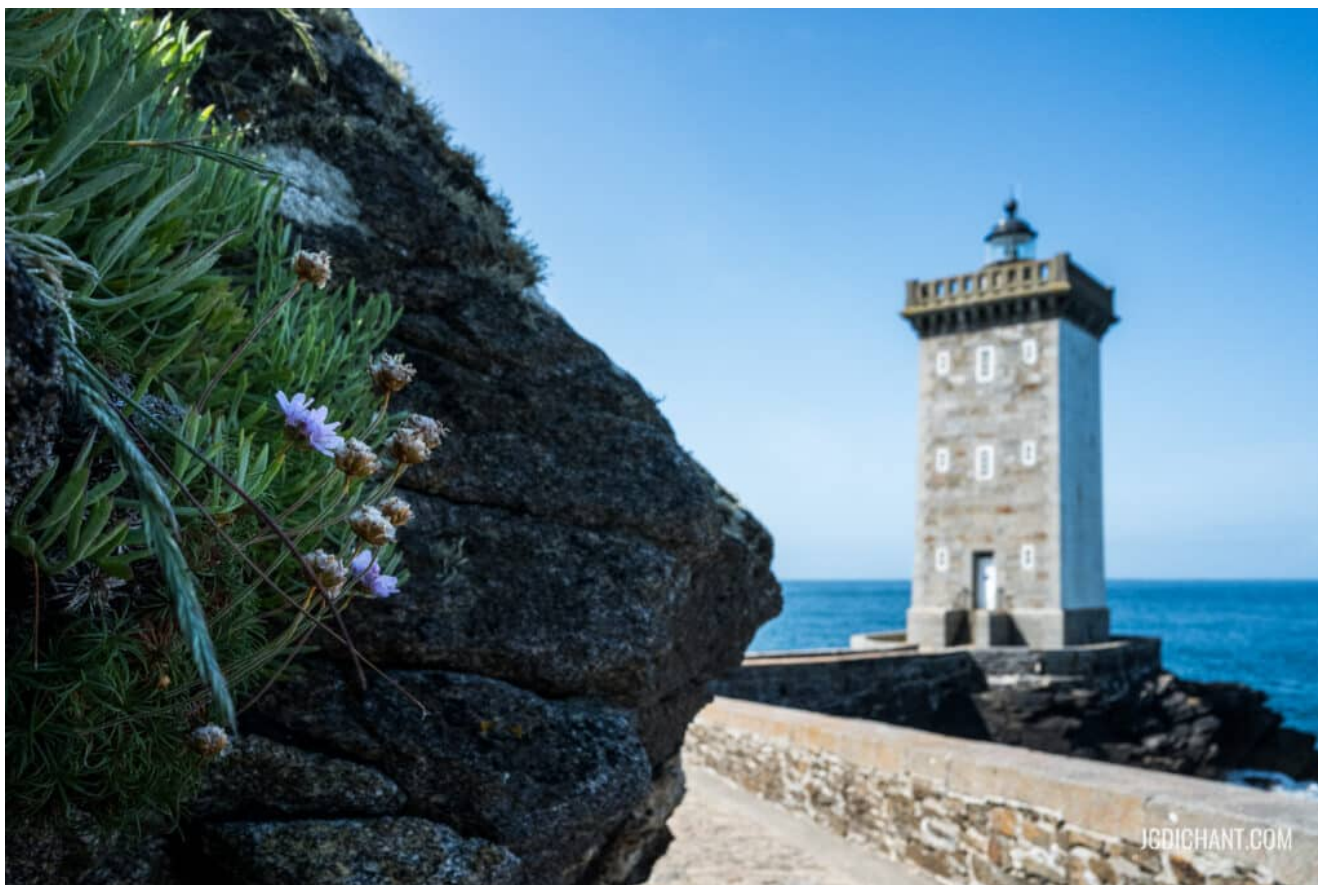
Un phare breton

Un exemple personnel : en Bretagne, j'ai photographié un phare en cadrant une fleur accrochée à un rocher au premier plan, le phare étant repoussé à l'arrière-plan, dans la moitié droite de la photo et dans le flou. Cette composition attire l'œil vers le phare car il est plus lumineux que la fleur sur son rocher. J'ai ainsi mis en œuvre le principe d'axe médian couplé au principe de composition par la lumière, sans respecter aucune règle connue et certainement pas celle des tiers.