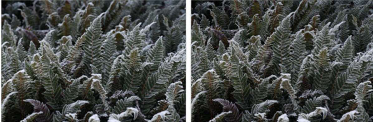
Photo classique à gauche - Focus Stacking à droite

Notez la très grande profondeur de champ de la photo de droite