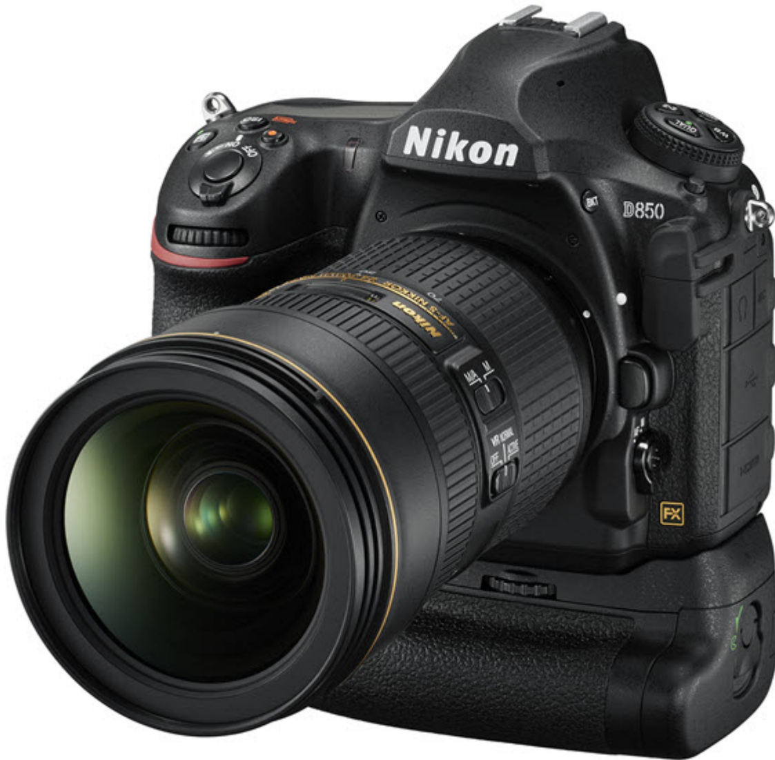
Le Nikon D850 avec le grip Nikon MB-D18

Le D850 permet l'utilisation d'un grip optionnel MB-D18 plus ergonomique et