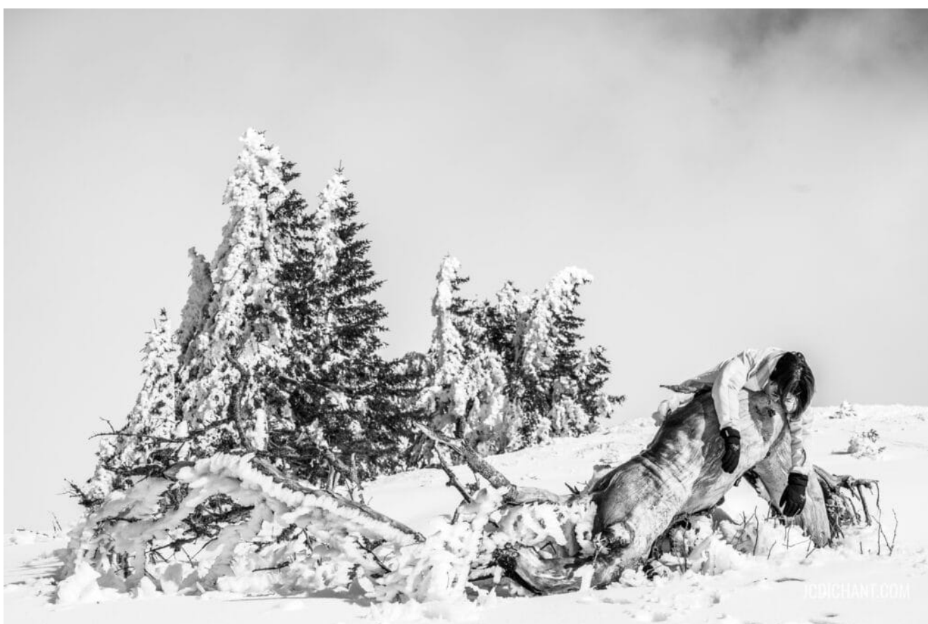
Paysage de neige habité

Tout le monde peut y arriver. Même vous. Vous avez un appareil photo, deux yeux, un vécu, des goûts, une sensibilité. Tout le monde a ça. Ce sont les seuls outils dont vous avez besoin. Le reste s'apprend.