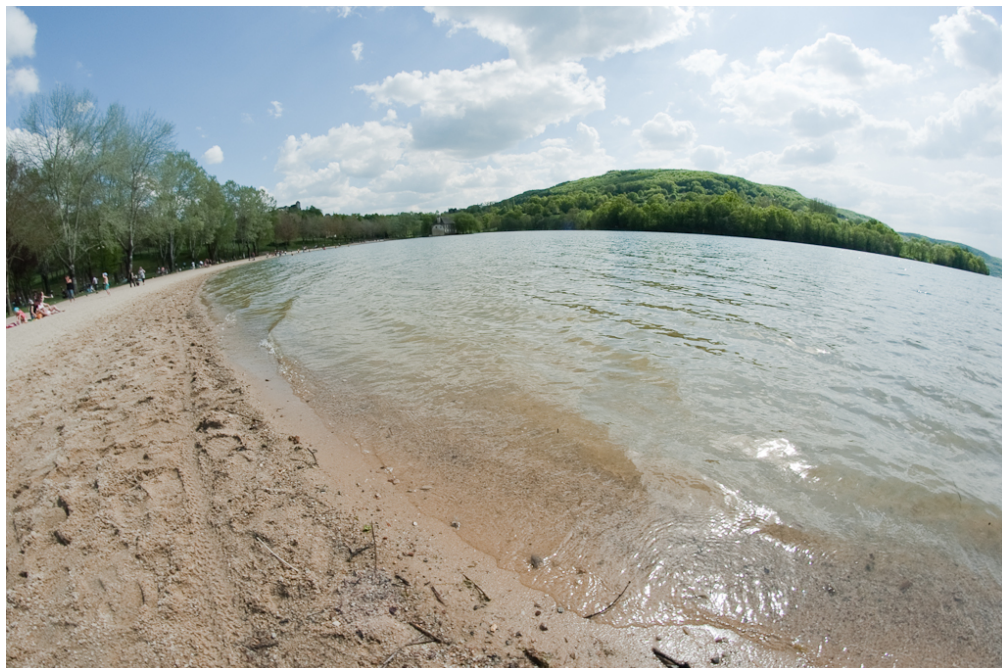
Boîtier tenu à l'horizontale