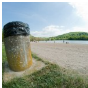
Samyang 8mm f/16

Recevez ma Lettre Photo quotidienne avec des conseils pour faire de meilleures photos : www.nikonpassion.com/newsletter