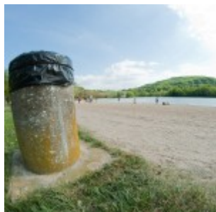
Samyang 8mm f/22