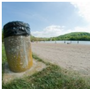
Samyang 8mm f/8