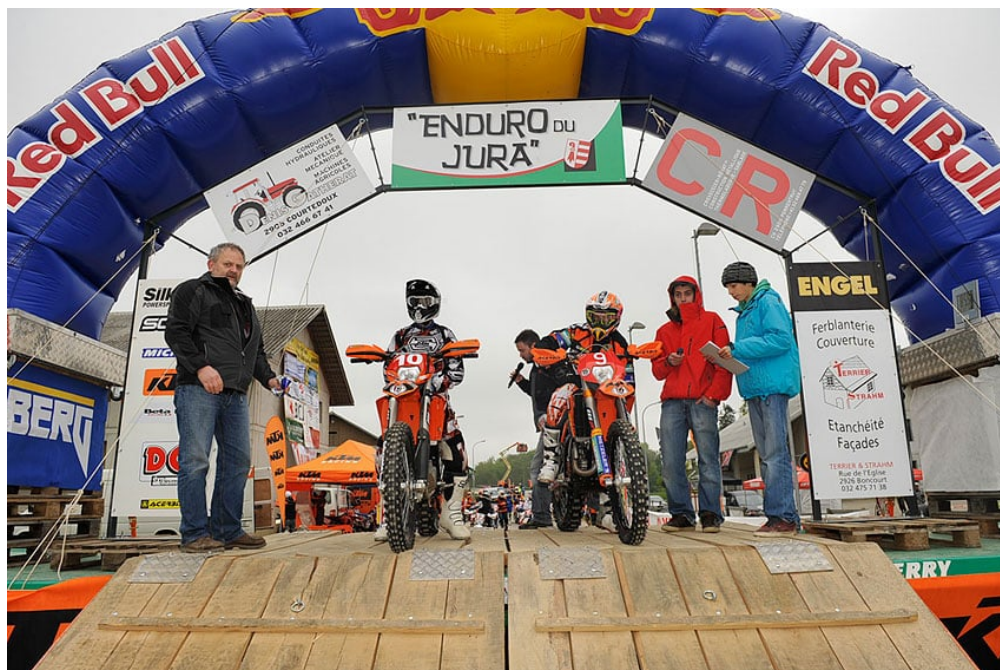
Départ de la deuxième édition de l'Enduro du Jura

Recevez ma Lettre Photo quotidienne avec des conseils pour faire de meilleures photos : www.nikonpassion.com/newsletter