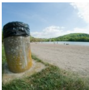
Samyang 8mm f/5.6

Recevez ma Lettre Photo quotidienne avec des conseils pour faire de meilleures photos : www.nikonpassion.com/newsletter