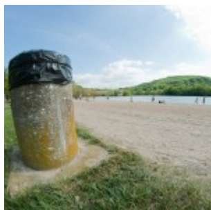
Samyang 8mm f/11