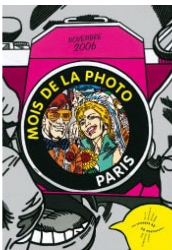
Affiche réalisée par Erró adaptation Loïc Le Gall

Recevez ma Lettre Photo quotidienne avec des conseils pour faire de meilleures photos : www.nikonpassion.com/newsletter