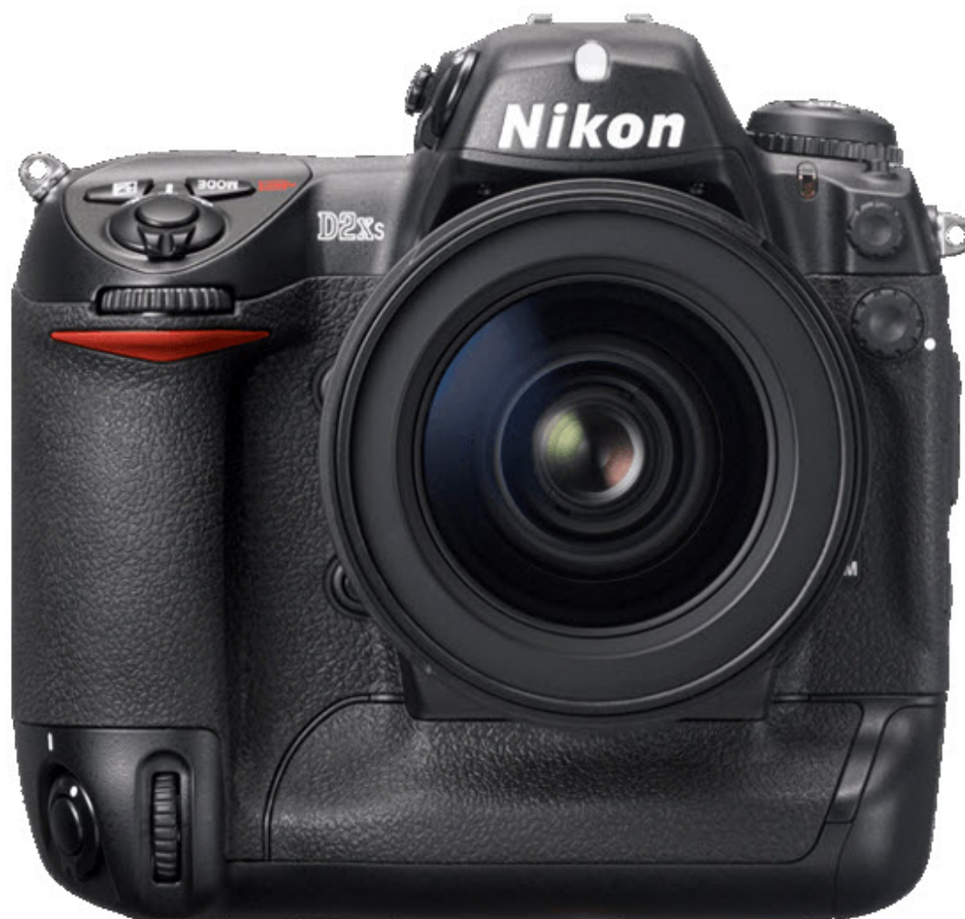
Le Nikon D2Xs vu de face

Recevez ma Lettre Photo quotidienne avec des conseils pour faire de meilleures photos : www.nikonpassion.com/newsletter