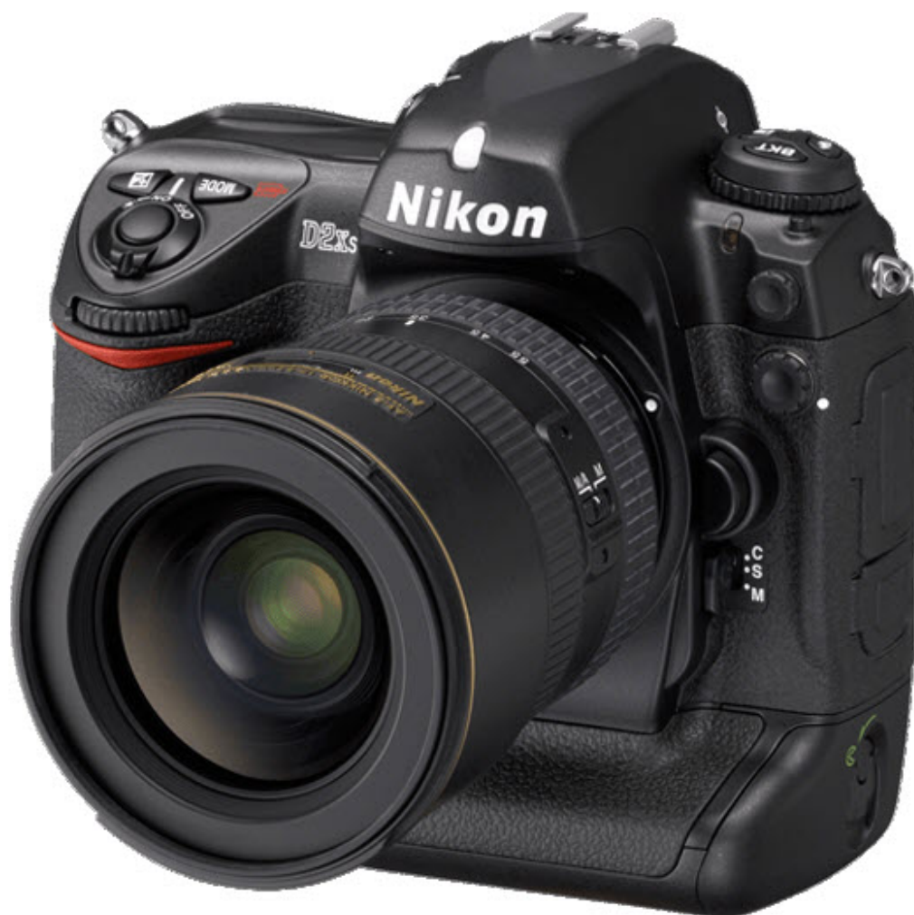
Nikon D2Xs, un reflex pro monobloc dans la lignée du D2x

Recevez ma Lettre Photo quotidienne avec des conseils pour faire de meilleures photos : www.nikonpassion.com/newsletter