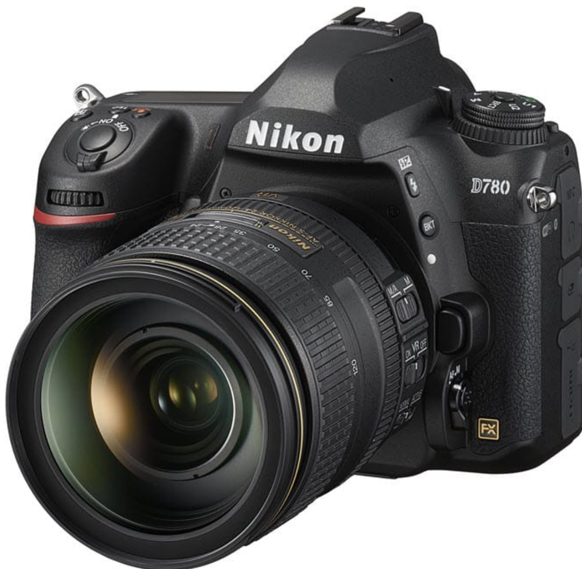
le reflex Nikon D780