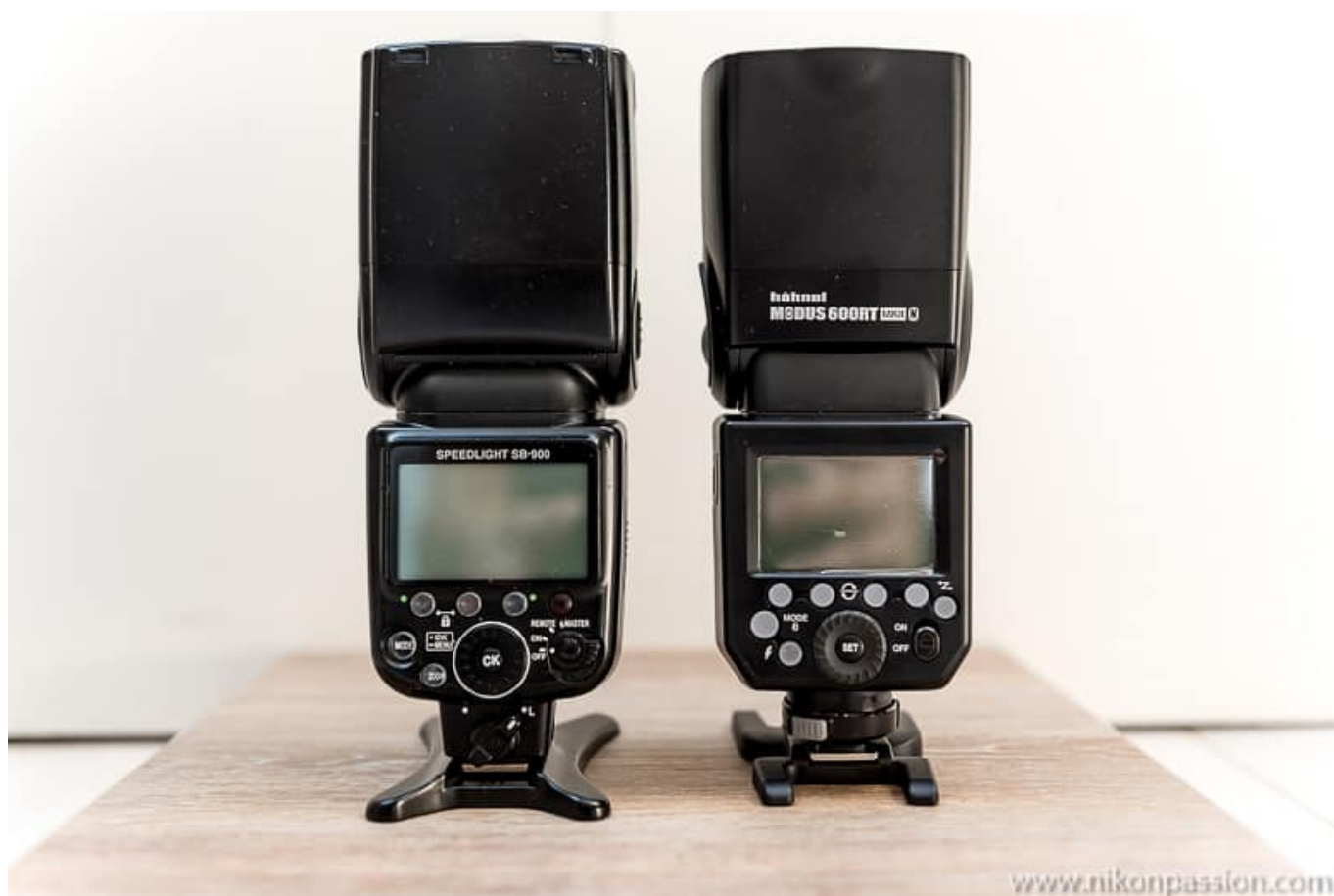
le flash Nikon SB-900 à gauche le flash Modus 600 RT MK II à droite

évident que Hähnel joue dans la cour des grands. Mais reprenons depuis le début, de quoi parle-t-on ici ?