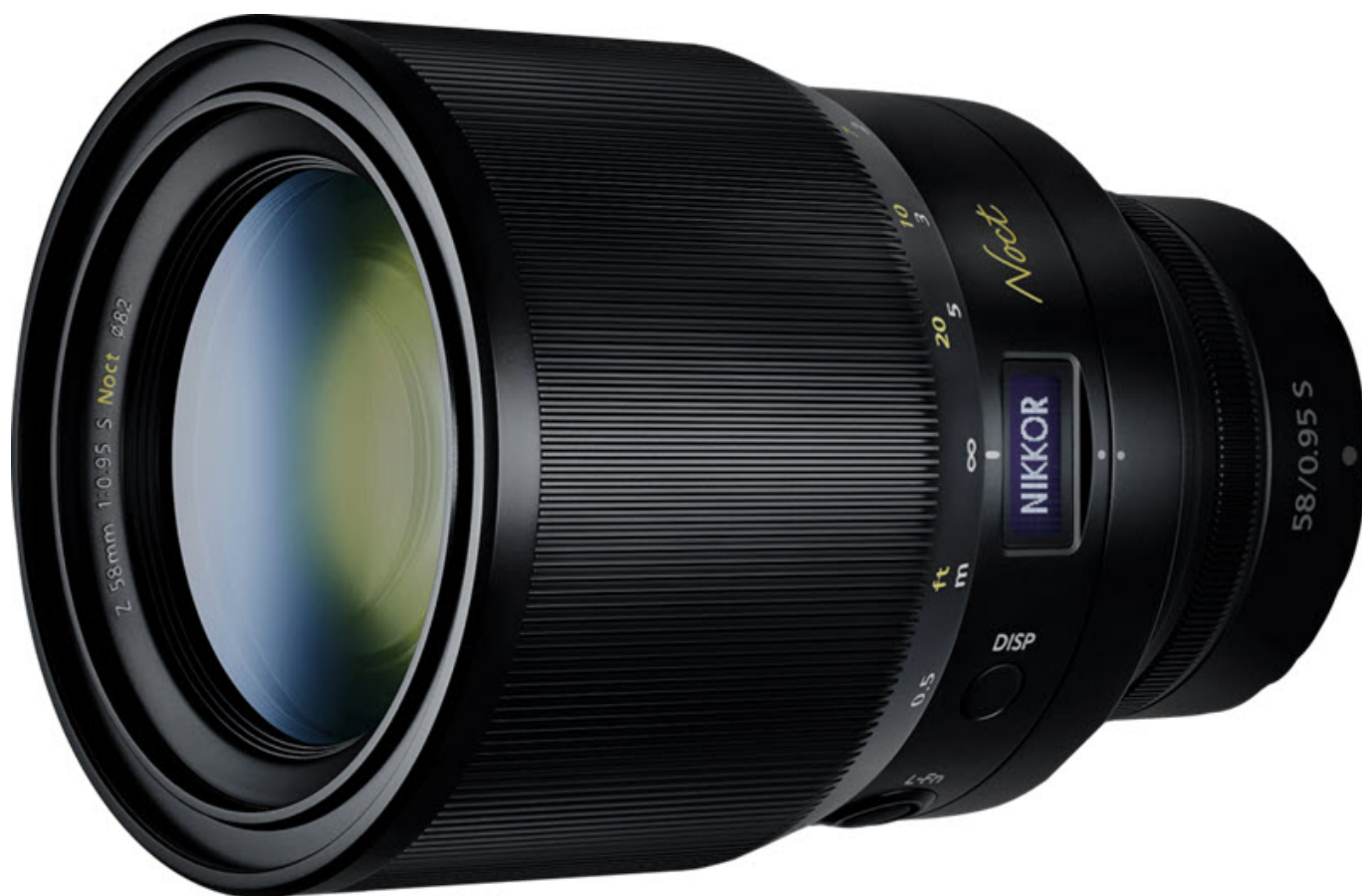
le NIKKOR Z 58 mm f/0.95 S Noct

L'exceptionnel et atypique NIKKOR Z 58 mm f/0.95 S Noct remporte lui le Prix du meilleur objectif à focale fixe pour hybrides.