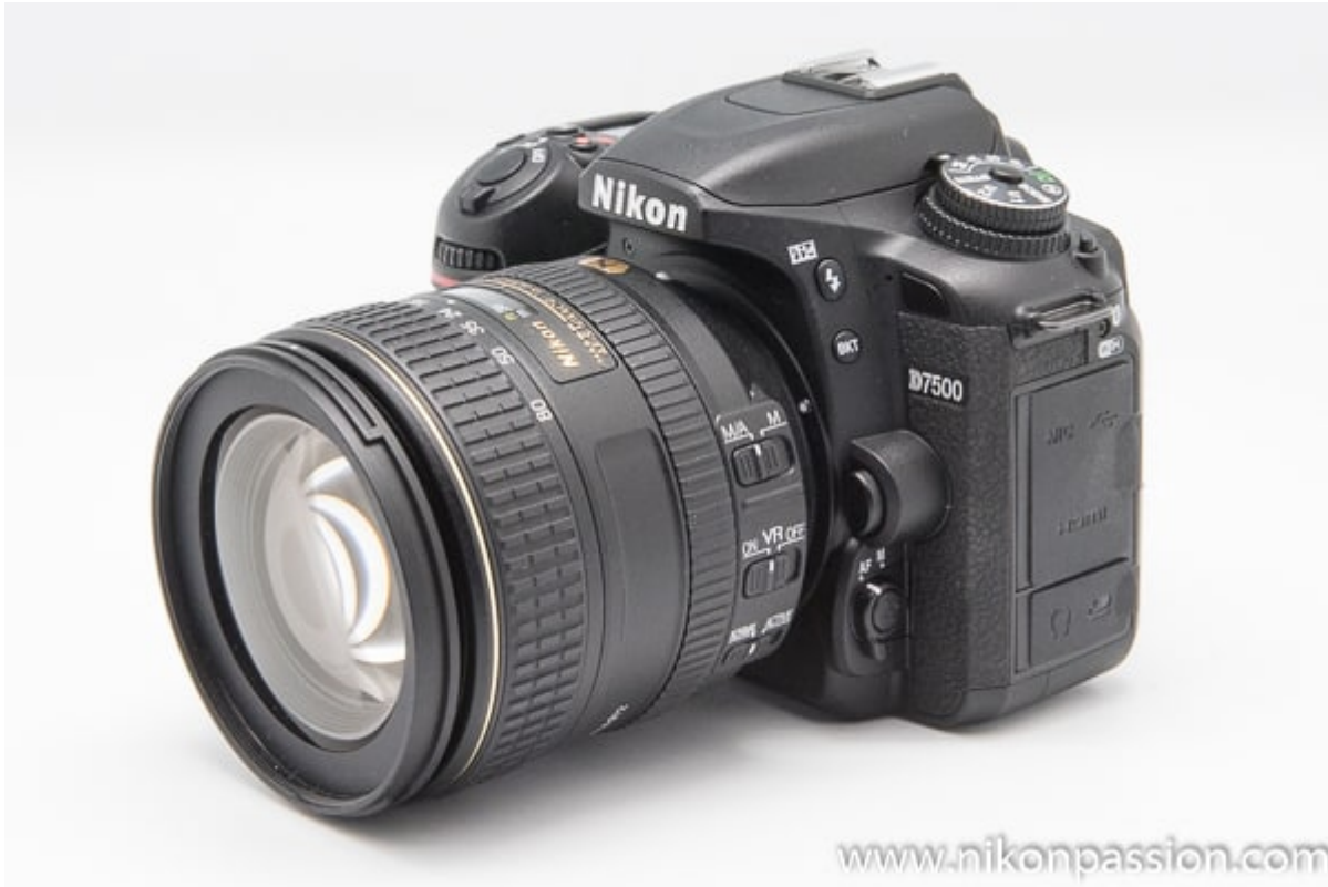
reflex Nikon D7500

Si le Nikon D5600 reste un modèle intéressant, le Nikon D7500 est un bon choix en APS-C. Son ergonomie diffère des entrées de gamme avec de nombreuses touches d'accès rapide et un menu plus complet. Le boîtier est bien construit, résistant.