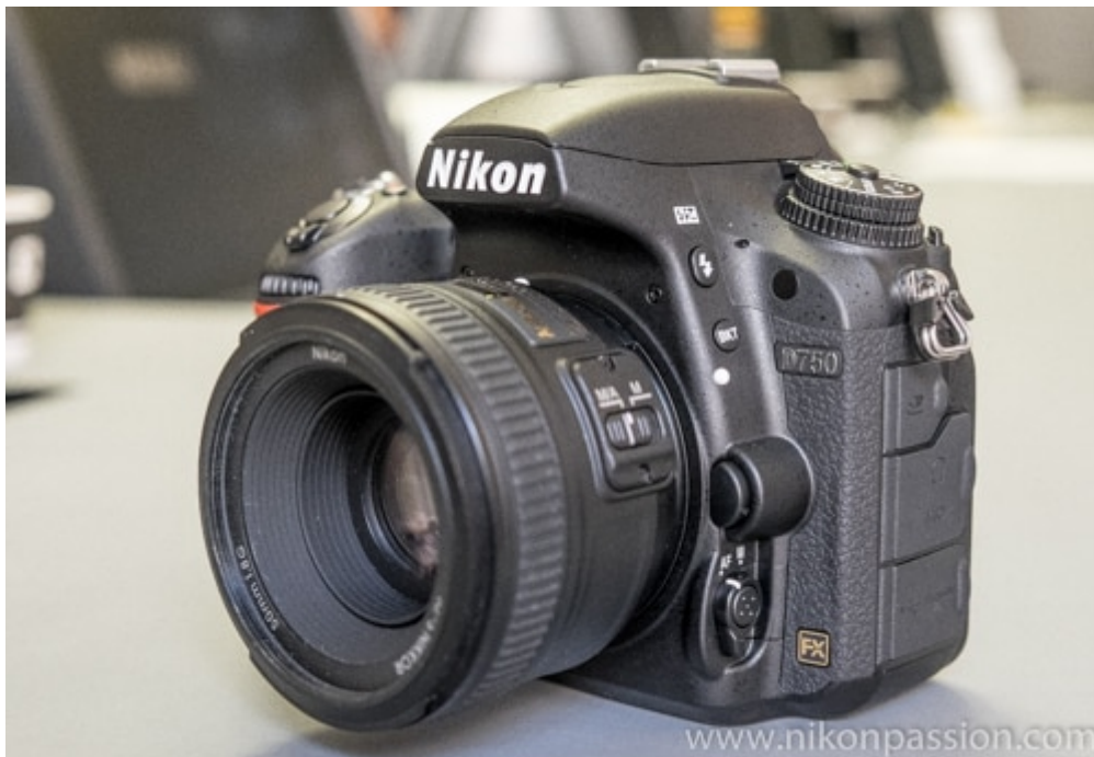
reflex Nikon D750

photographes qui voient en lui un des meilleurs reflex Nikon de ces dernières années, devant le plus exclusif Nikon D850, les inaccessibles Nikon D5/D6 ou le plus récent Nikon D780 plus onéreux.