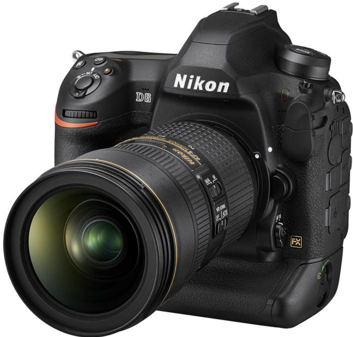
reflex Nikon D6