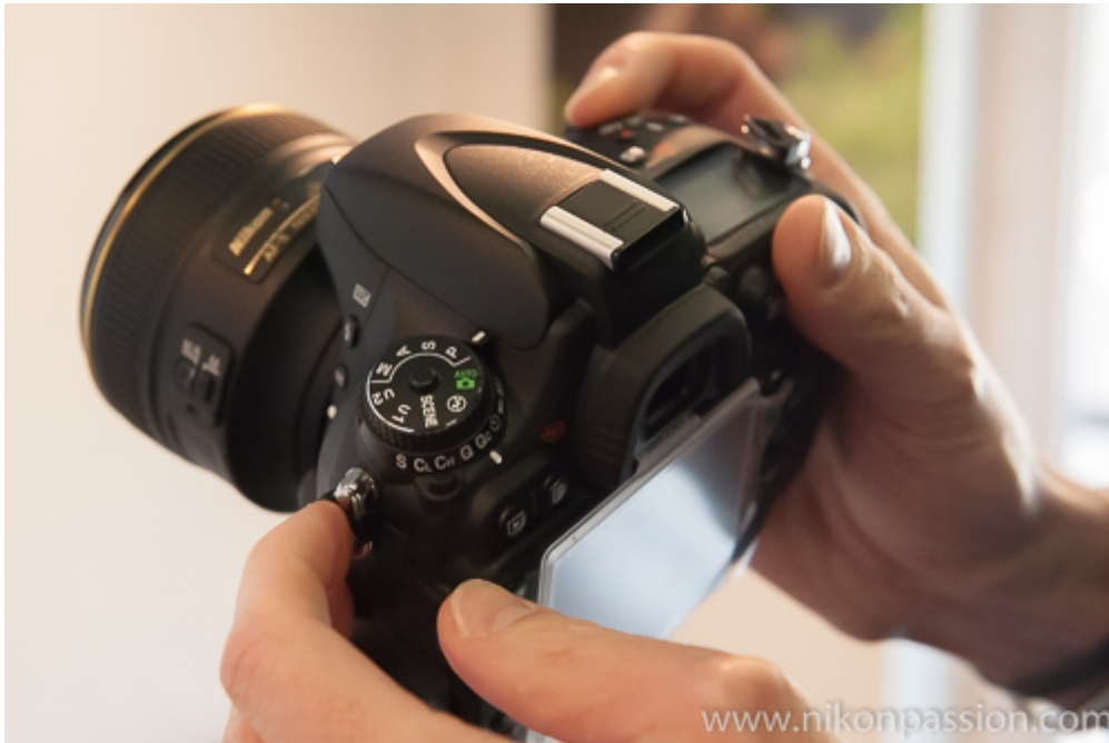
reflex Nikon D610

D610 se trouve à petit prix désormais, en occasion car il a disparu des rayons.