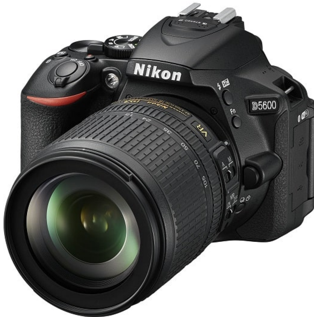
reflex Nikon D5600