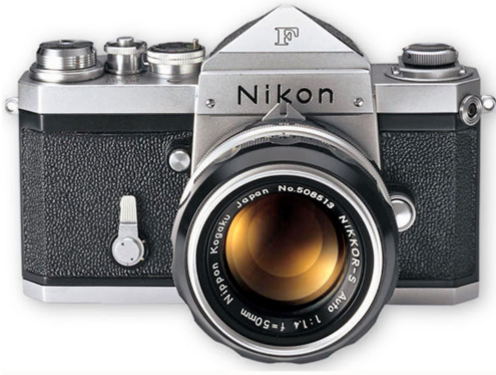
le reflex Nikon F de 1959

☐ Fiche BONUS : quel modèle pour passer du reflex à l'hybride Nikon