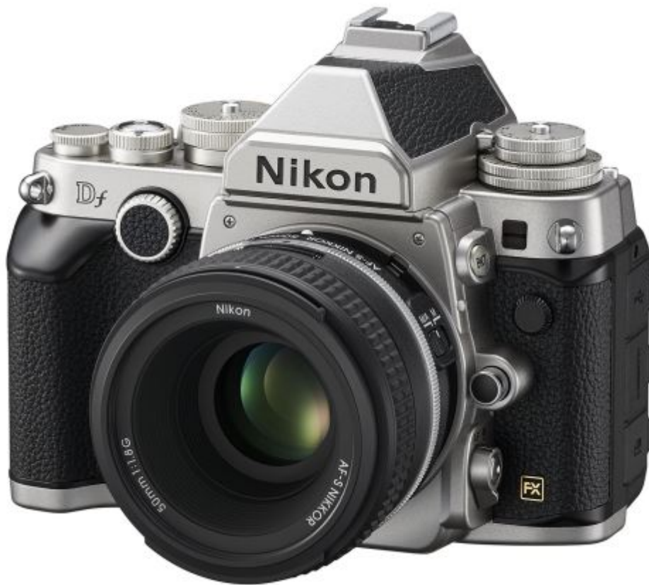
reflex Nikon Df en version chromé (existe aussi en noir)

Ce boîtier exclusivement dédié à la photographie (pas de mode vidéo) peut utiliser toutes les optiques produites par ou pour Nikon depuis toujours et possède un capteur pro puisque c'est celui de l'ex-modèle pro Nikon D4.