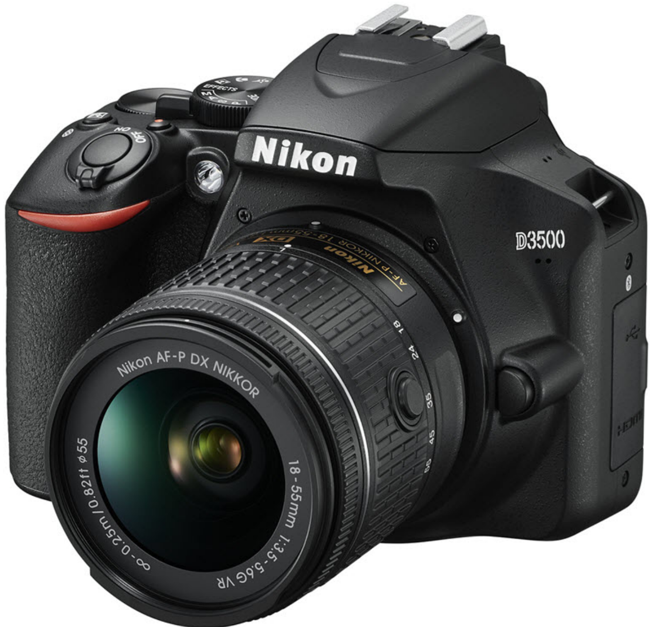
reflex Nikon D3500