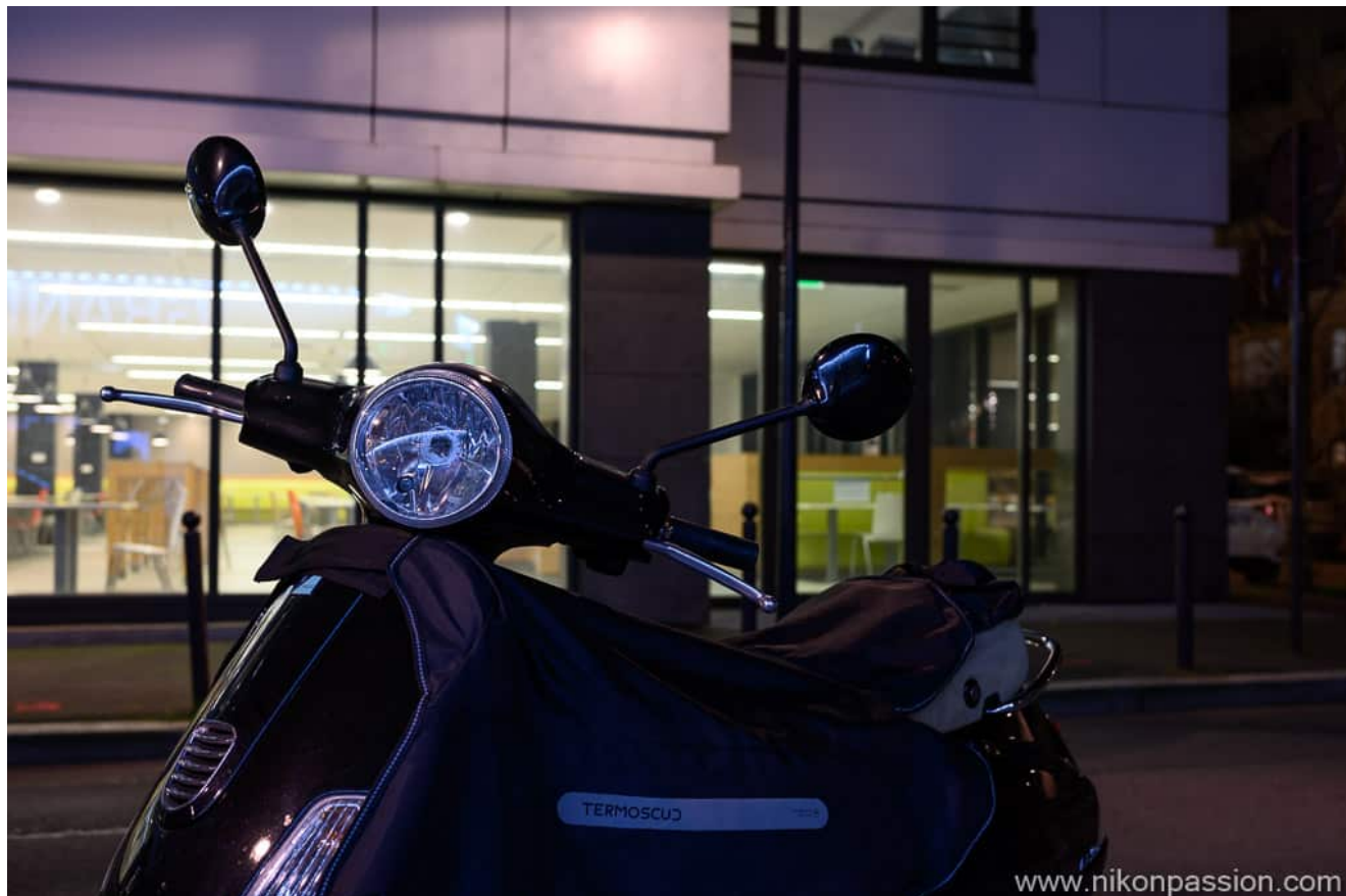
Nikon Z6II + NIKKOR Z 40 mm f/2 - 1/5ème - f/5 - ISO 100