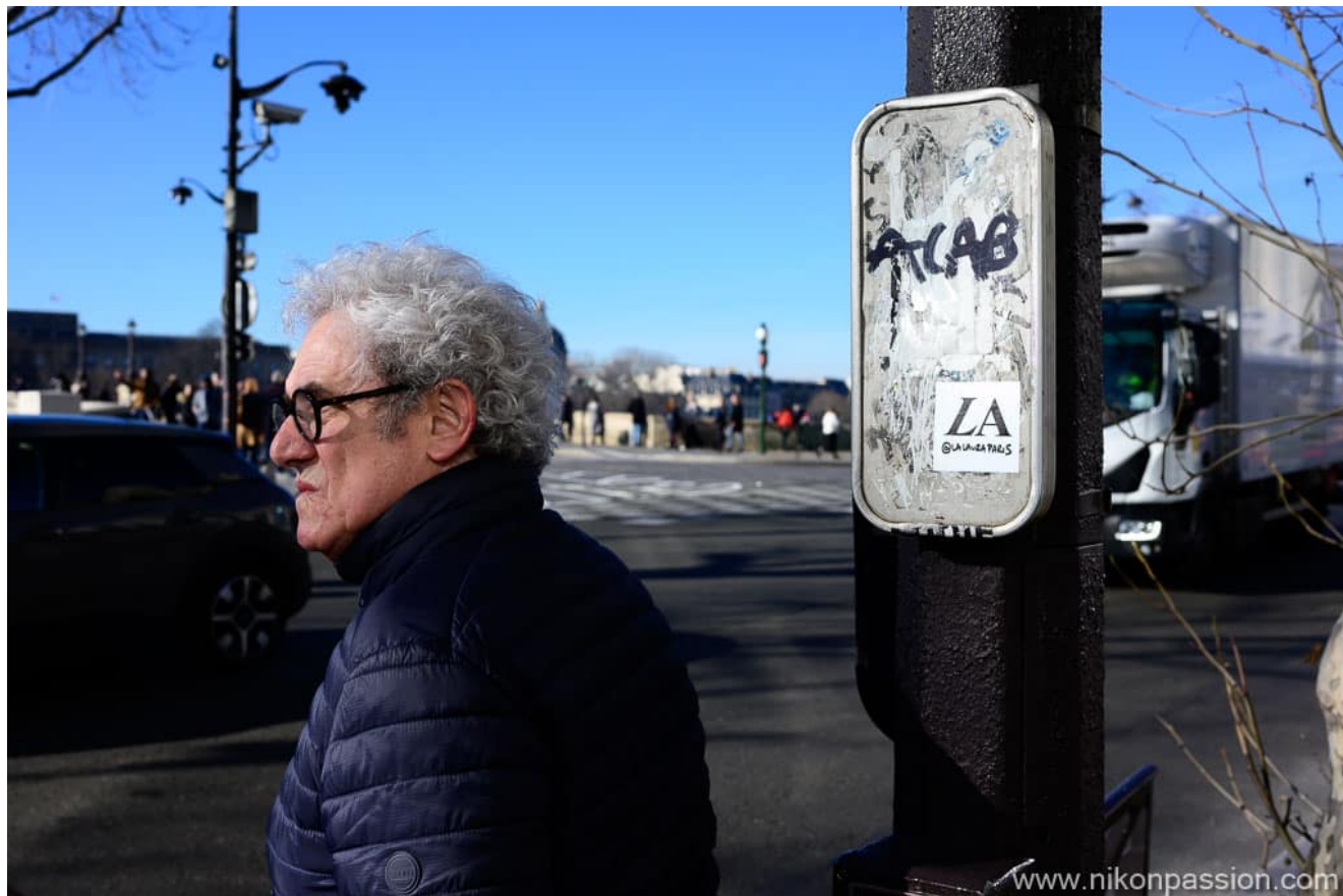
Nikon Z6II + NIKKOR Z 40 mm f/2 - 1/800ème - f/8 - ISO 250