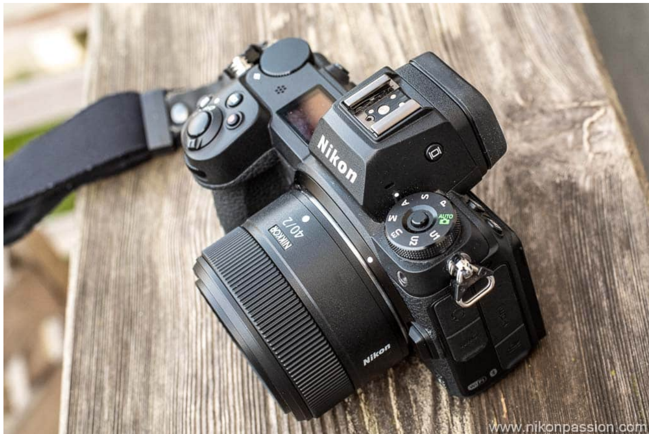
Le NIKKOR Z 40 mm f/2 sur Nikon Z 6II