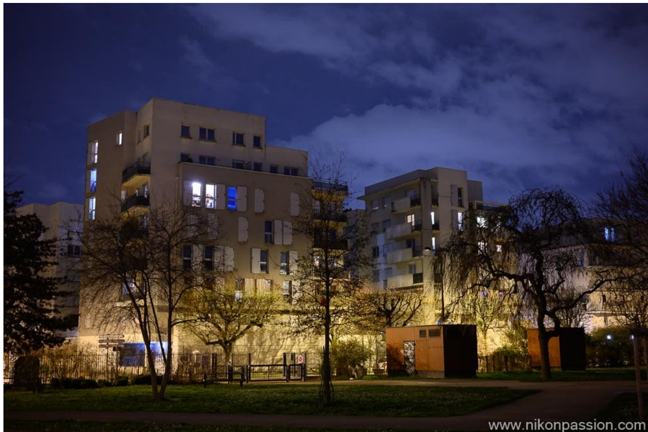
Nikon Z6II + NIKKOR Z 40 mm f/2 - 1/13ème - f/2.5 - ISO 800