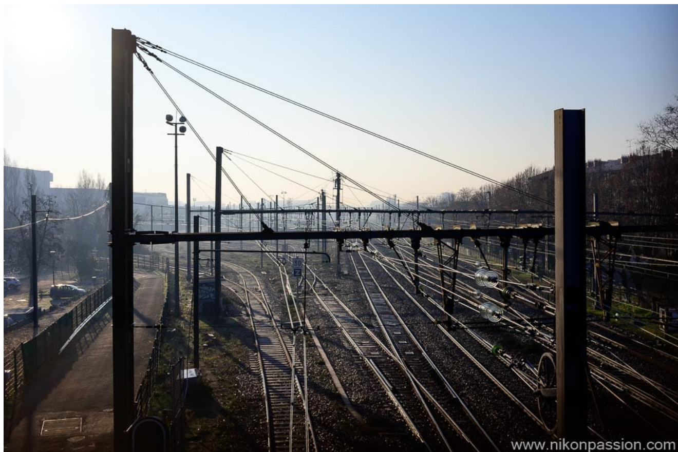
Nikon Z 6II + NIKKOR Z 40 mm f/2 - 1/800ème - f/8 - ISO 110