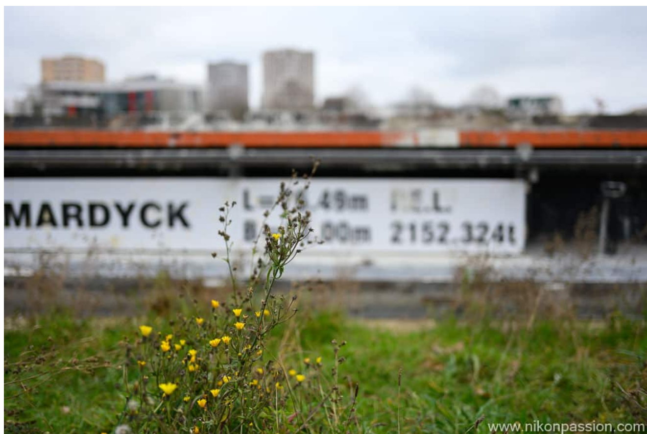
Nikon Z6II + NIKKOR Z 40 mm f/2 - 1/800ème - f/2 - ISO 320

logique, disposer d'une seule bague est limitant mais à l'usage vous allez voir que l'on s'en passe aisément. Je vous rappelle que l'on parle d'une optique de 170 gr et 5 cm de long.