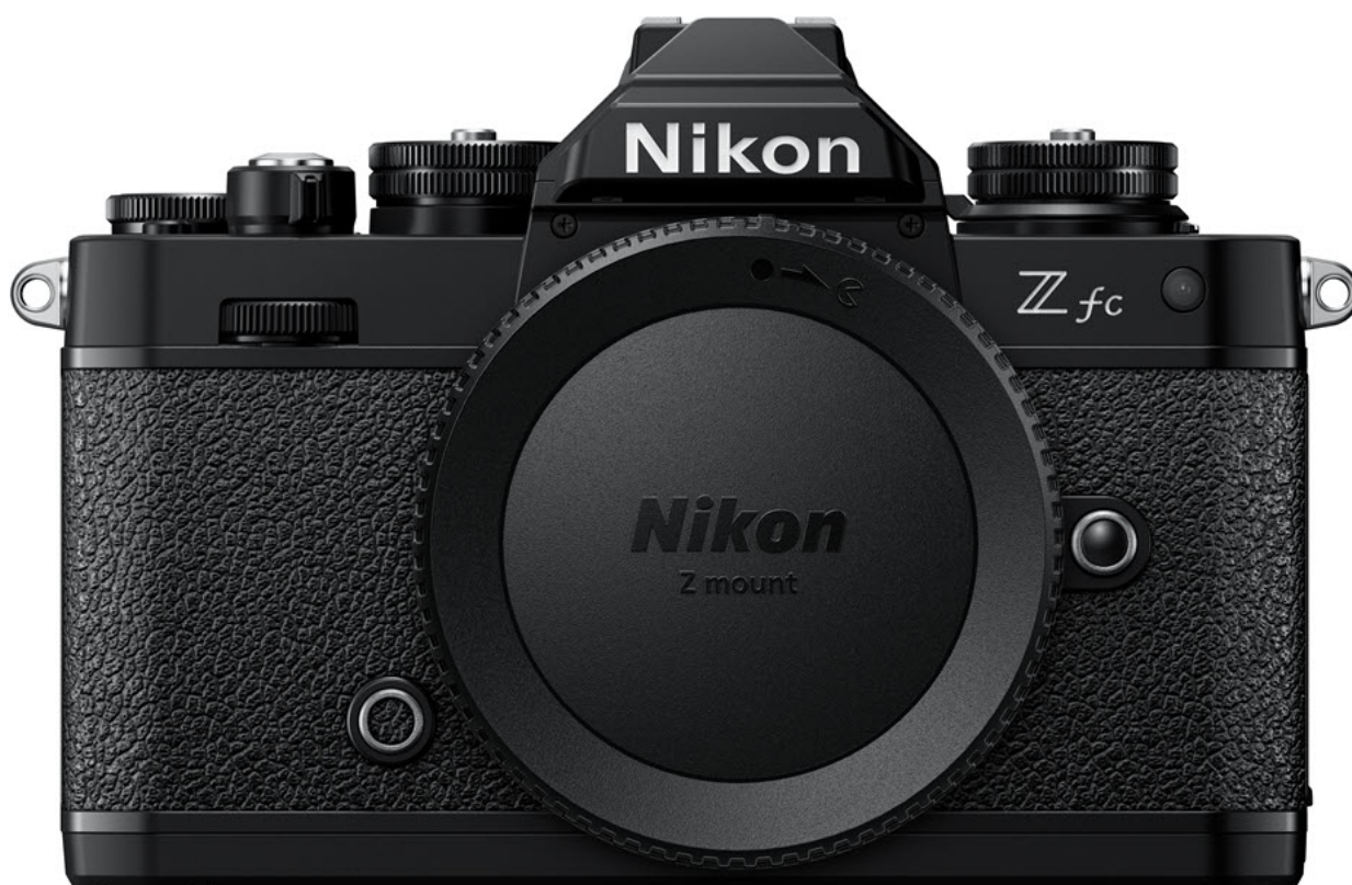
Nikon Z fc édition noir