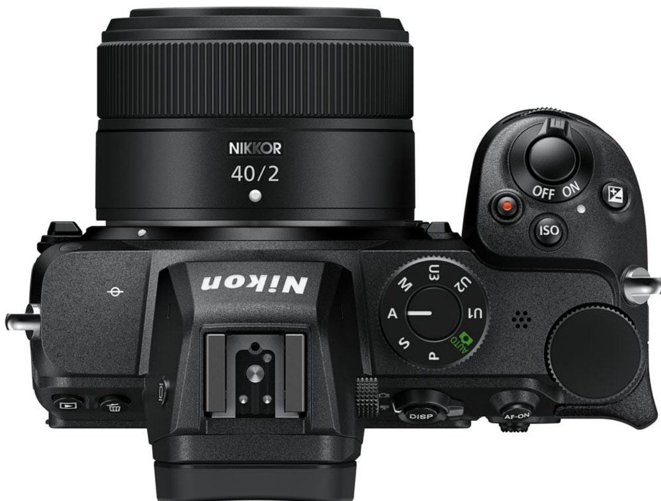
Le NIKKOR Z 40 mm f/2 sur Nikon Z 5