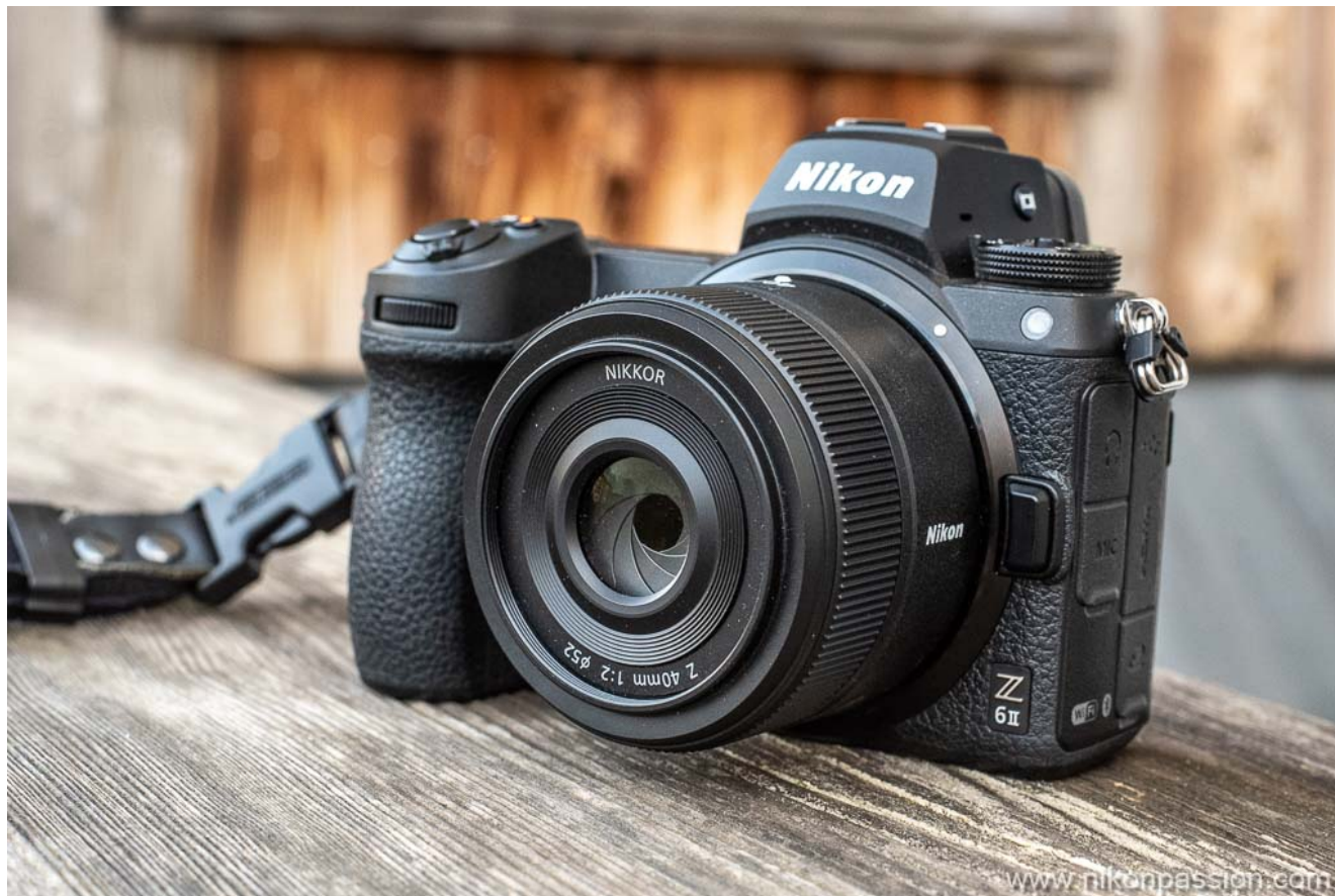
Le NIKKOR Z 40 mm f/2 sur Nikon Z 6II

Vous me répondrez qu'il me suffisait d'utiliser le NIKKOR Z 50 mm f/1.8 S, ou le 35 mm, ou encore l'AF-S Nikkor 50 mm f/1.8 avec la bague FTZ. C'est vrai, mais tant leur poids que leur taille ne jouent pas en leur faveur. Je ne parle pas du budget, quant à la bague, elle ajoute une longueur et un poids non négligeables avec un 50 mm.