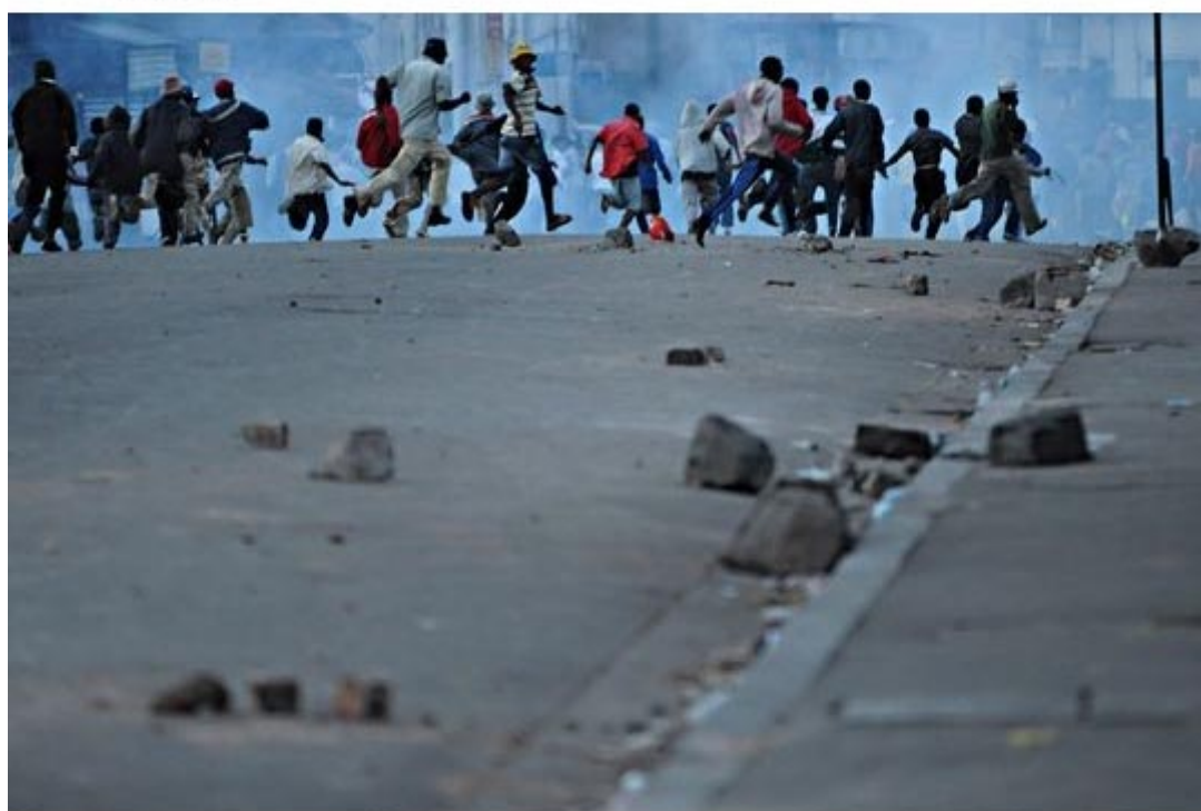
Lauréat 2009

Cette année, Patrick de Carolis sera le Président d'Honneur du Scoop, il remplace Edward Behr .