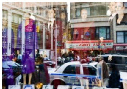
Pierre - Elie de Pibrac American showcase photographes

Qualité en présence de l'artiste mardi 2 juin 2010 - de 18h00 à 20h00