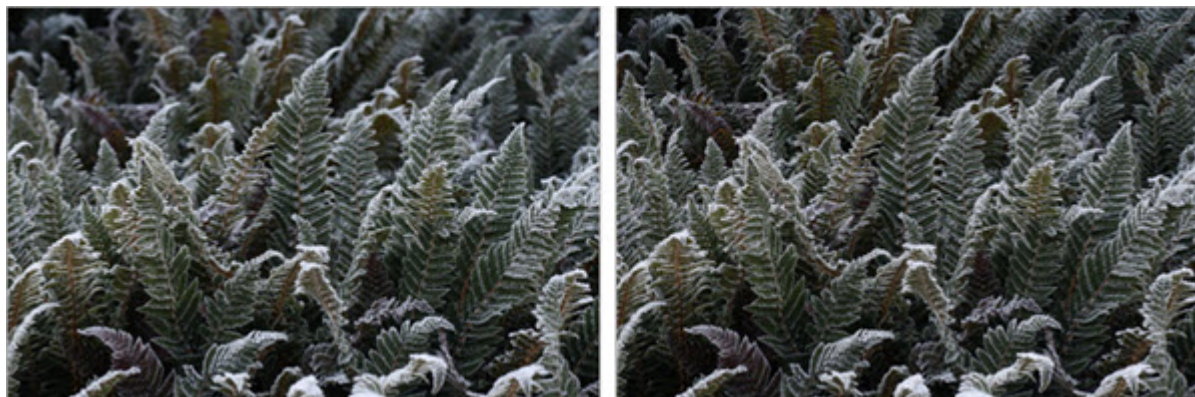
Photo classique à gauche - Focus Stacking à droite Notez la très grande profondeur de champ de la photo de droite

Le Nikon D850 permet d'automatiser la procédure de prise de vue en gérant le décalage de mise au point. Le boîtier peut enregistrer jusqu'à 300 photos avec 300 mises au point différentes.