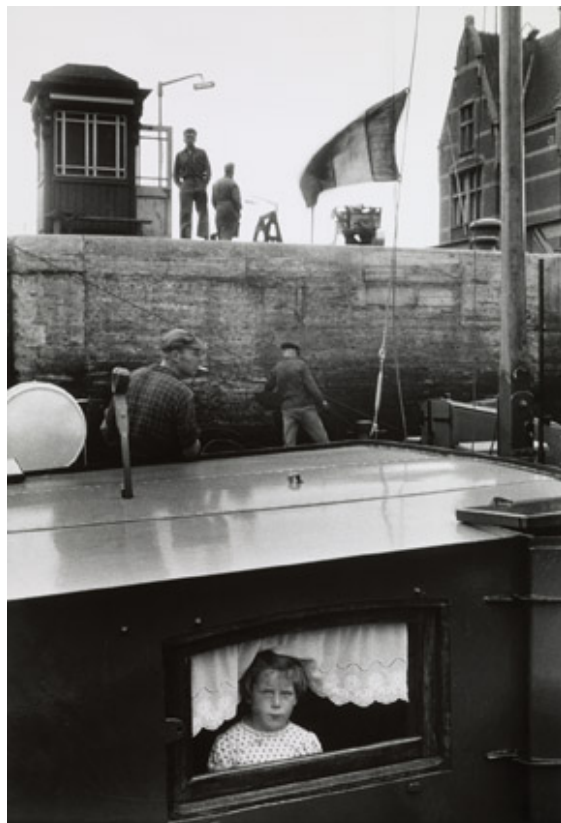
Écluse à Anvers 1957 Willy Ronis Tirage argentique, 35 x 25 cm