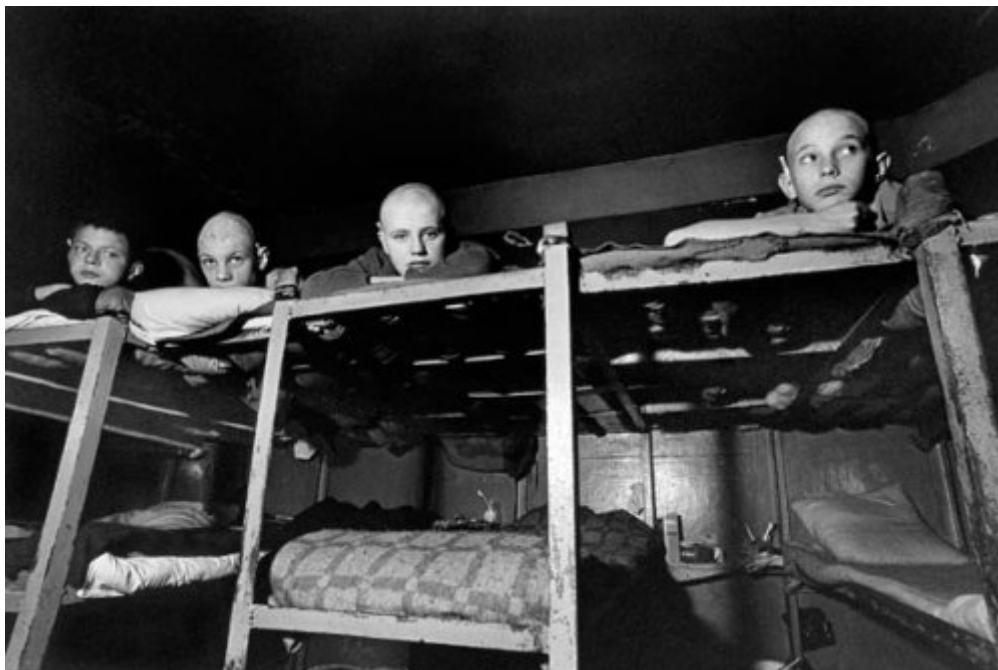
Isolateur d'instruction de Lebedeva, Russie, 2001