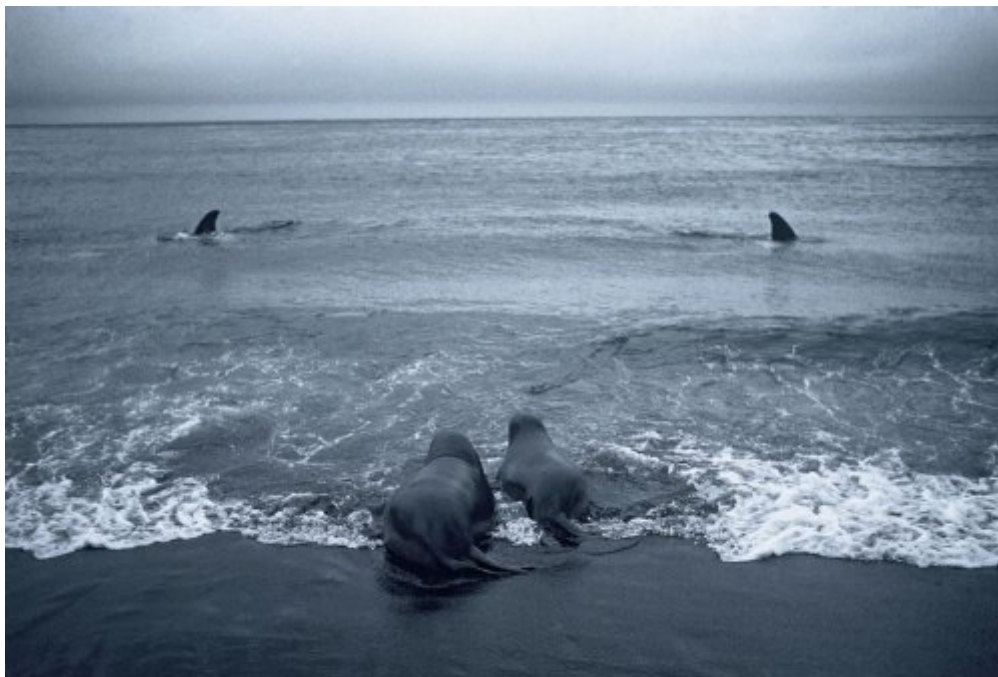
Archipel de Crozet, Ile de la possession, 1998