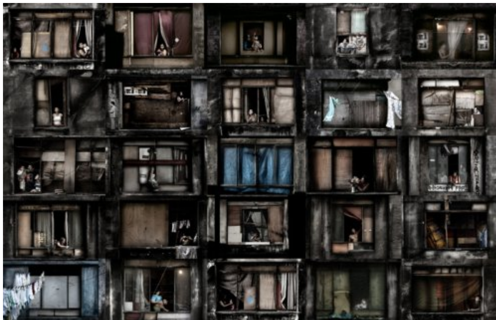
Prestes Maia 911, Sao Paulo 2005 à 2008

Au programme de l'exposition également, Marc Riboud - qui était présent lors du vernissage, et a évoqué à la rédaction de Nikon Passion sa récente interview à l'Assemblée Nationale, dans le cadre de la réflexion sur l'avenir du photojournalisme - avec des photos sur la révolution iranienne et l'indépendance algérienne, mais aussi les photos en noir et blanc de Kosuke Okahara , São Paulo vue par Carlos Cazalis , et, également sur le thème de la croissance de la ville, les « fenêtres sur cour » de Julio Bittencourt .