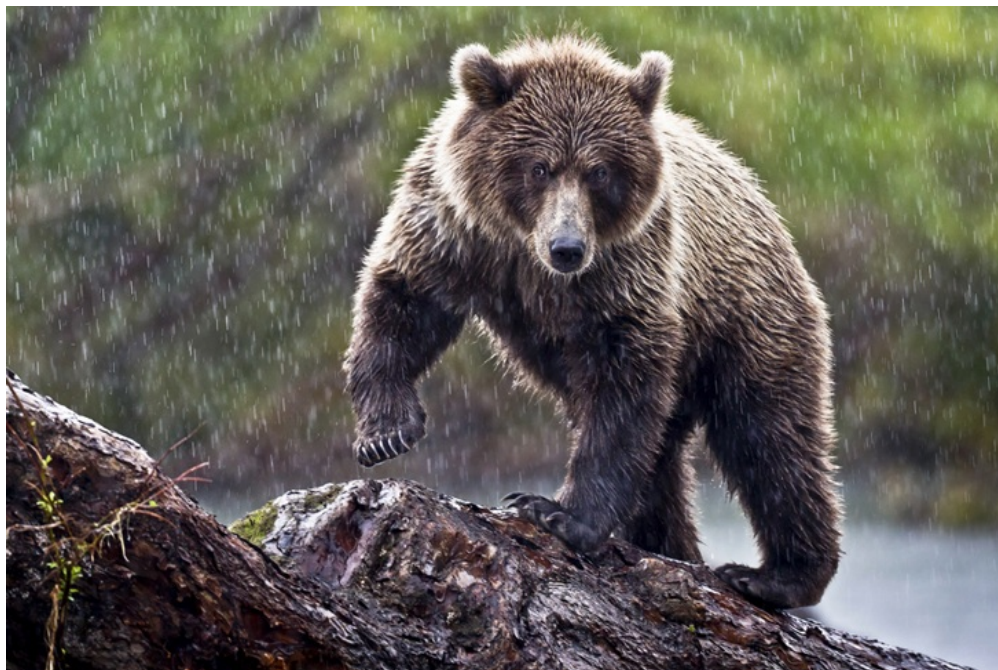
Ours brun

Qu'il piste des gorilles au Rwanda ou des ours en Russie, Kyriakos Kaziras raconte. Une certitude : il aime profondément son métier. Et il n'y a qu'à observer ses images pour comprendre ce qui le pousse. Tel ce gorille (note NP: ne fait pas référence à la photo ci-dessus) qui vous jauge du coin de l'œil, pris de si près que l'on perçoit la rugosité des mains et le détail du moindre poil. Pour lui, la photo, c'est un regard, une émotion, que ce soit un animal, un paysage, une situation.