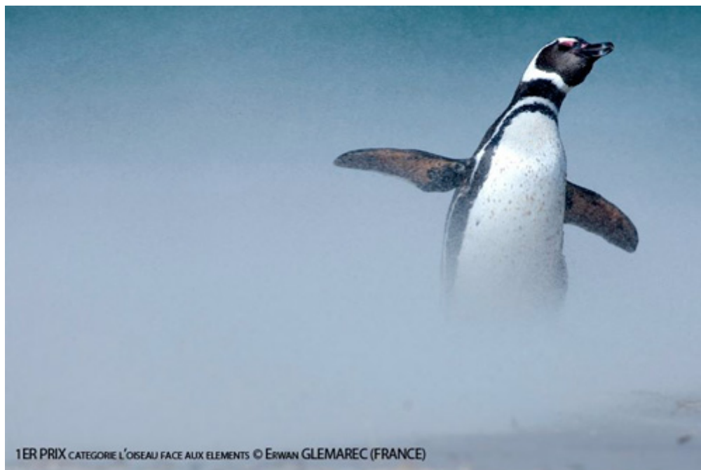
Manchot de Magellan, Spheniscus magellanicus