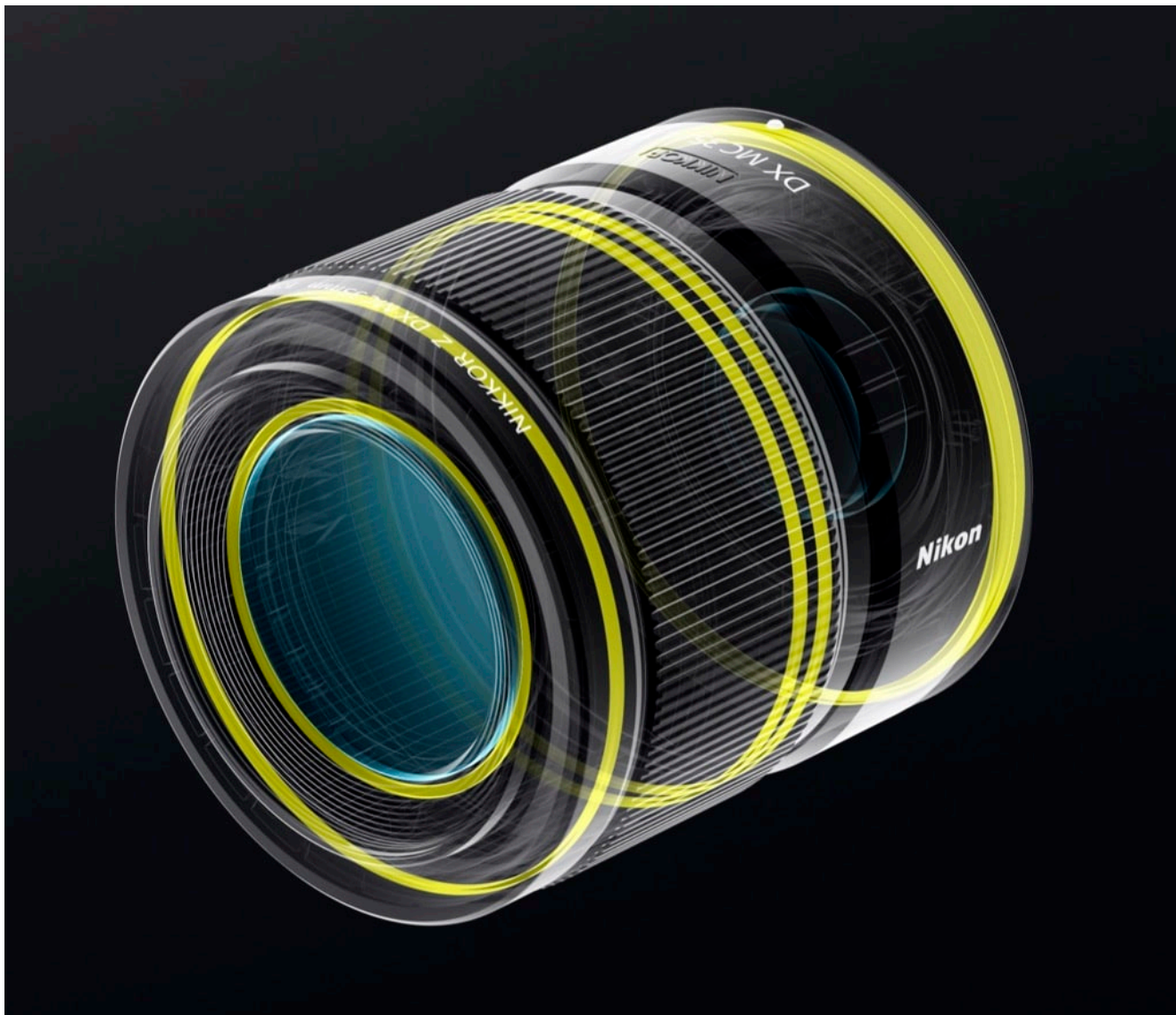
NIKKOR Z DX MC 35 mm f/1.7 : protection tous temps

Enfin, son poids plume de 220 g et sa construction protégée contre la poussière et l'humidité en font un compagnon de voyage idéal. Compact, léger et robuste, il se