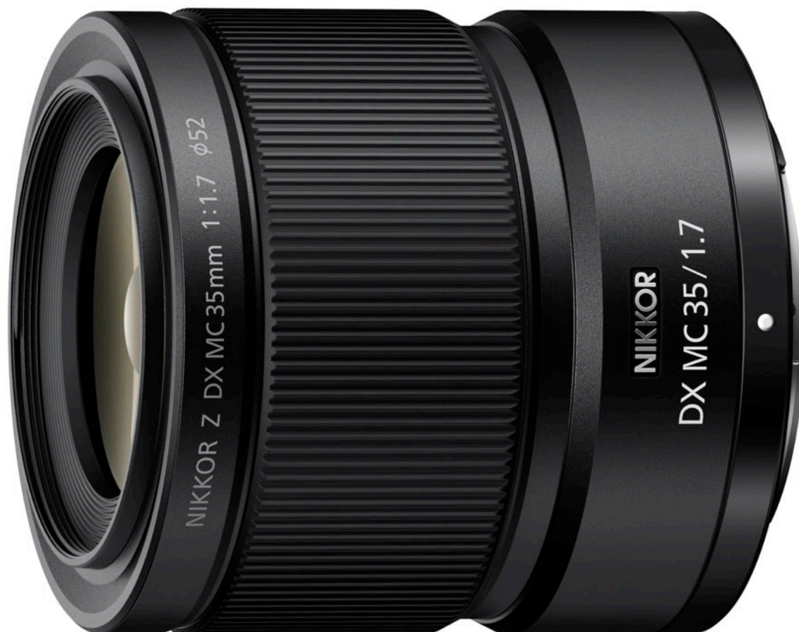
NIKKOR Z DX MC 35 mm f/1.7

Ce NIKKOR Z DX Macro chez La Boutique Photo Nikon