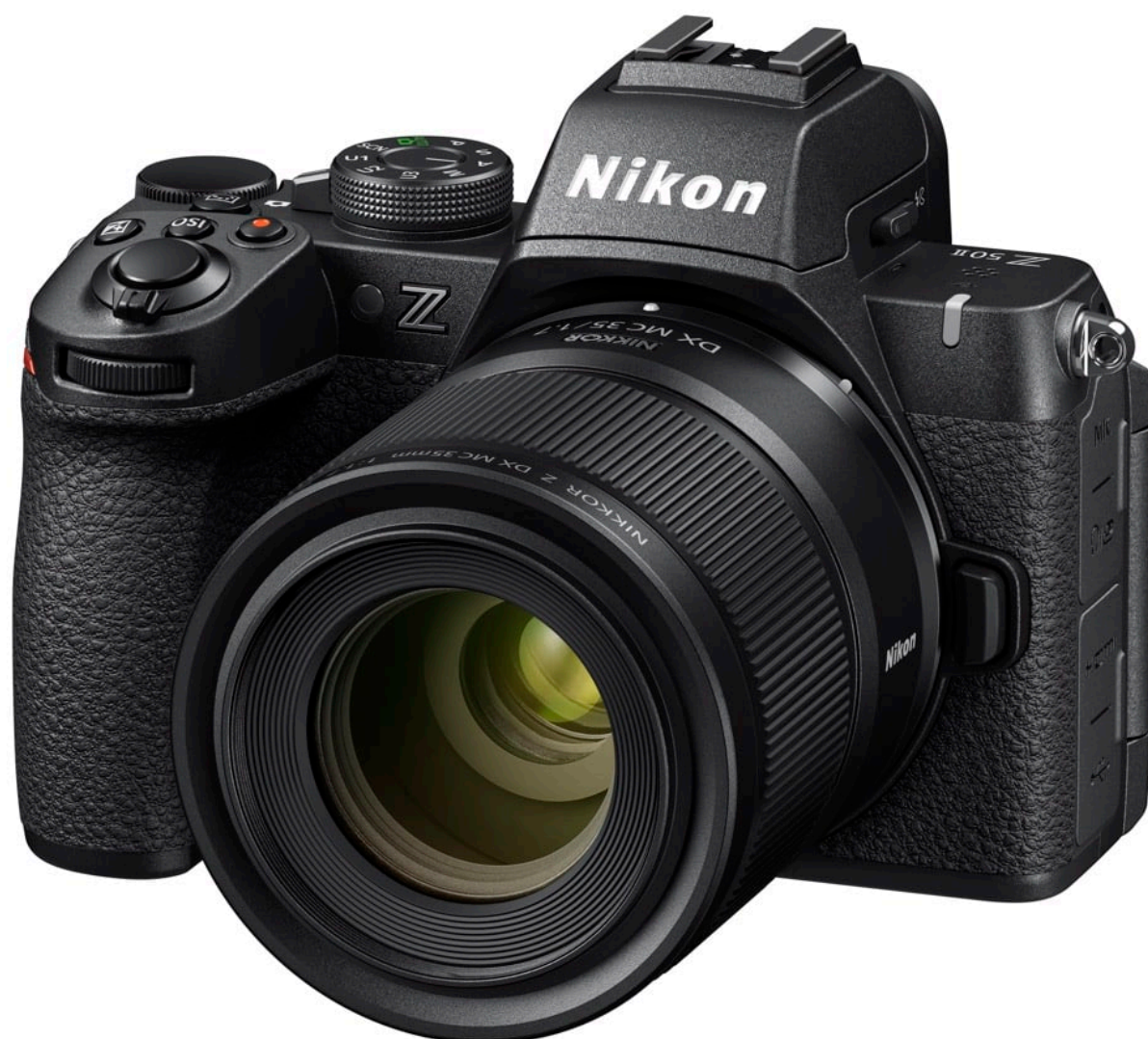
NIKKOR Z DX MC 35 mm f/1.7 sur Nikon Z50II