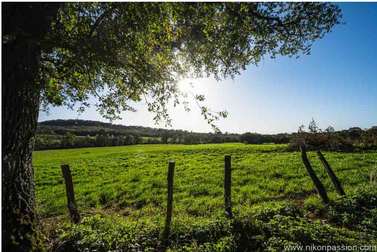
Un paysage du Lot au 14 mm