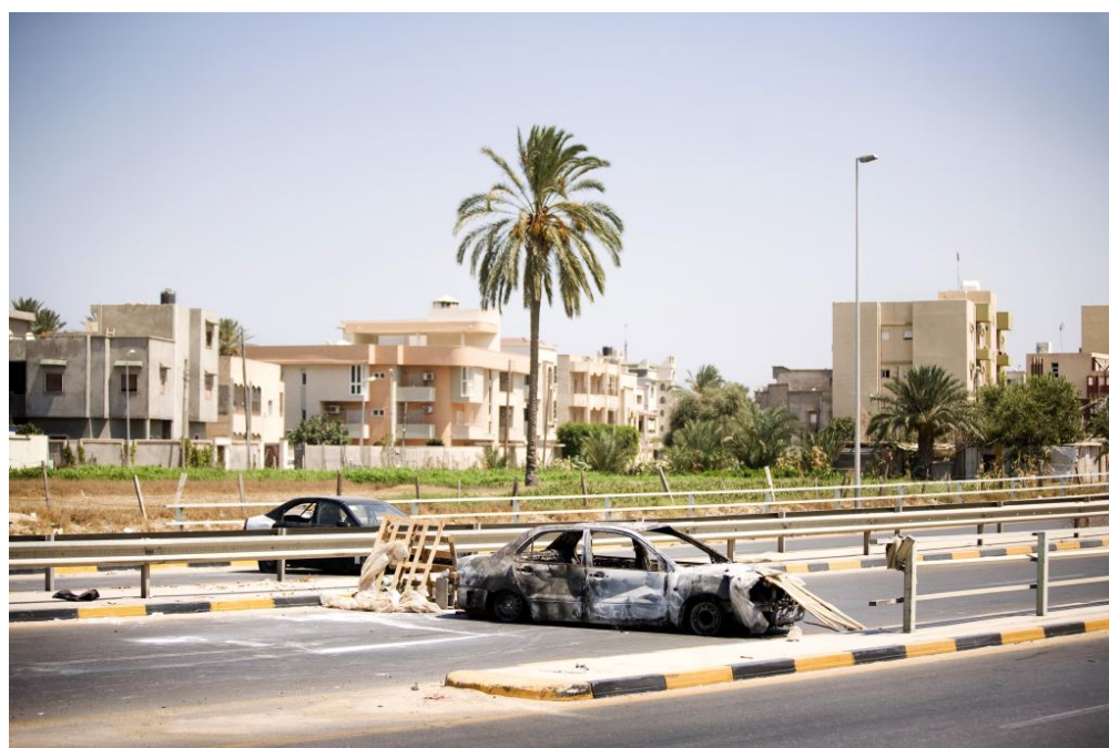
cliquer sur l'image pour la voir en grand

Curieux d'en savoir plus sur le parcours de ce jeune photojournaliste, nous sommes allés à sa rencontre.