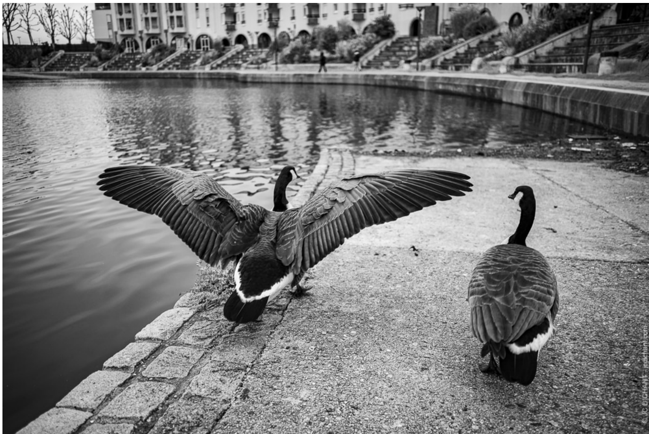
Les oies bernache du Canada – lac de Créteil

De nombreux photographes amateurs n'osent pas le noir et blanc, car ils ne savent pas quoi faire de ces images souvent peu séduisantes en version « brut de carte ». Produire un noir et blanc direct de qualité (lire « en JPG ») est effectivement difficile sans une bonne maîtrise des réglages de votre appareil.