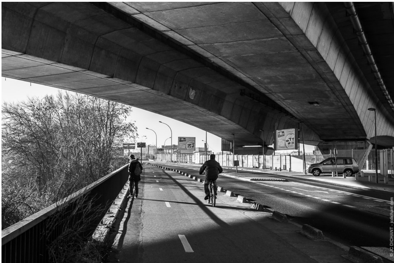
Sous l'A86