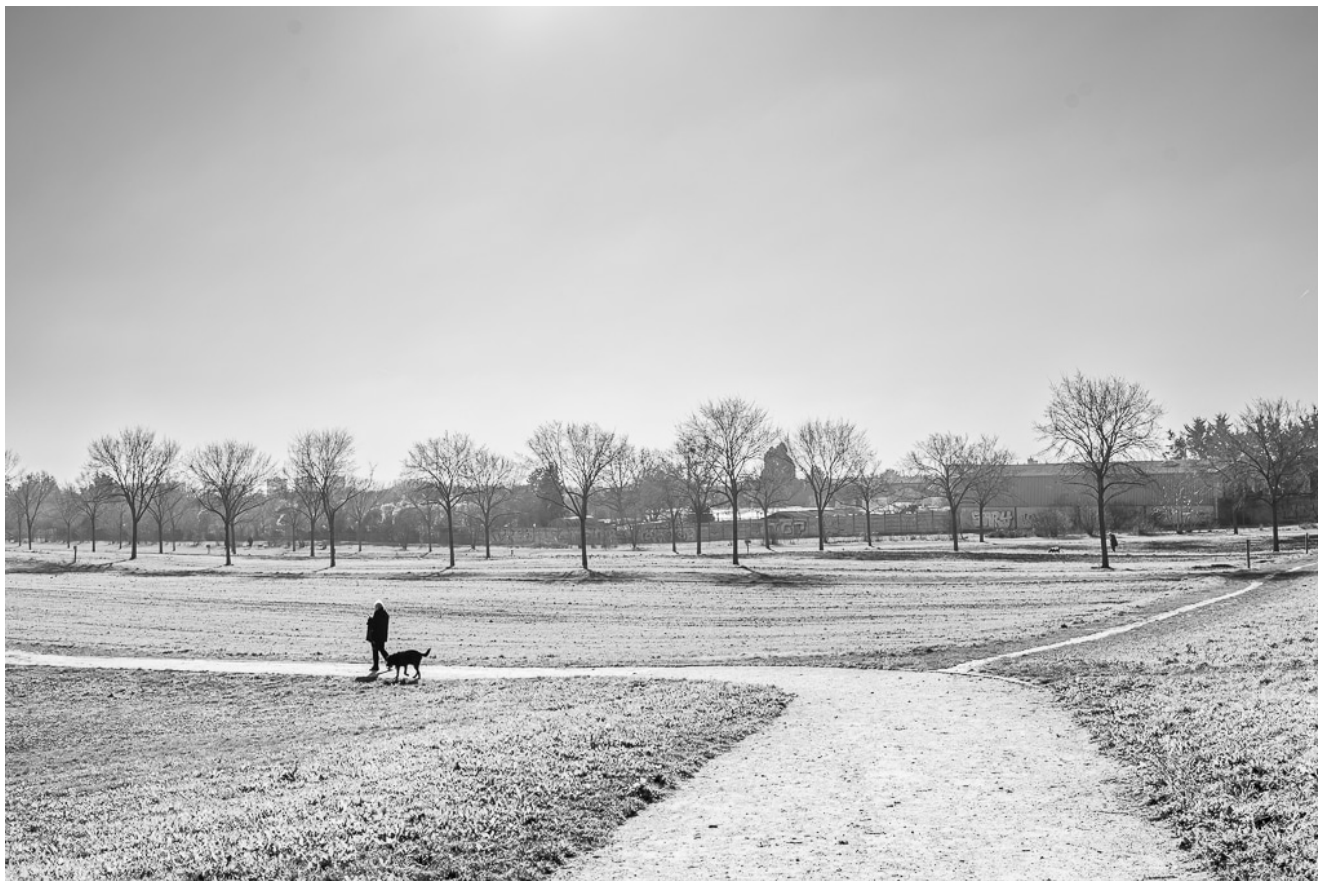
Parc des lilas de Vitry sur Seine