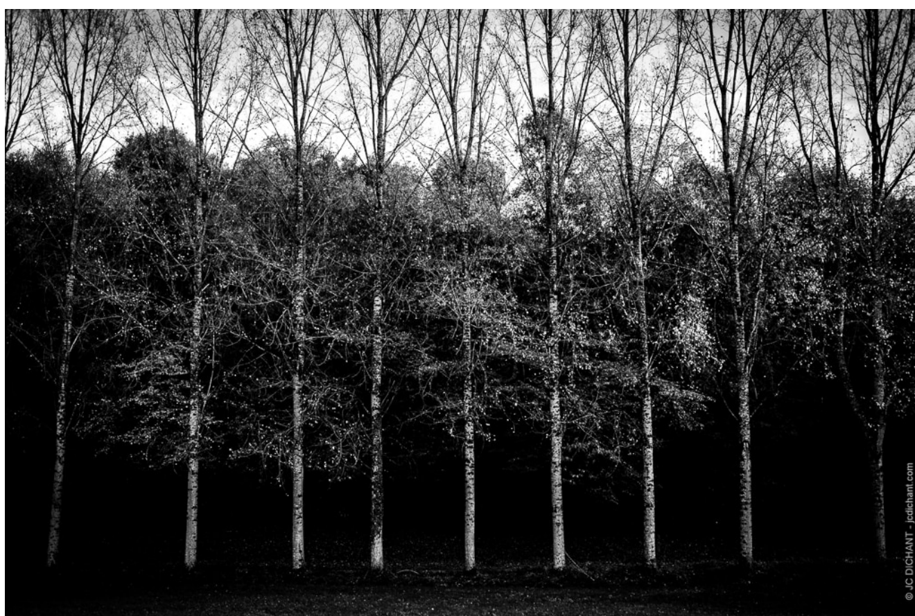
Alignement d'arbres dans le Lot - photo (C) JC Dichant

Photographiez un paysage urbain sous une pluie battante, une rue déserte éclairée par des réverbères, un visage éclairé par une lumière latérale ou un alignement d'arbres et vous obtiendrez des images puissantes et dramatiques en noir et blanc.