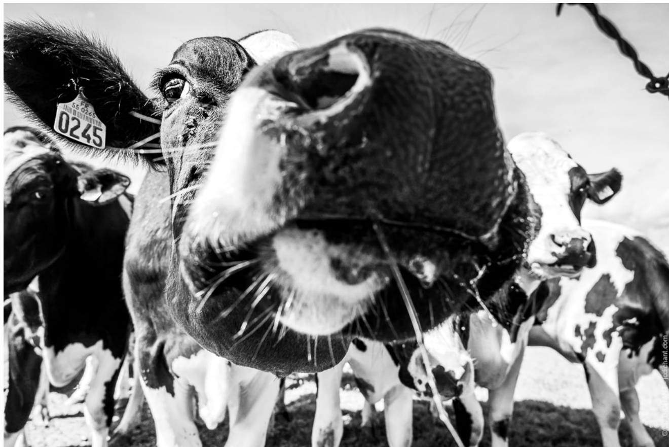
Les vaches de la Meuse