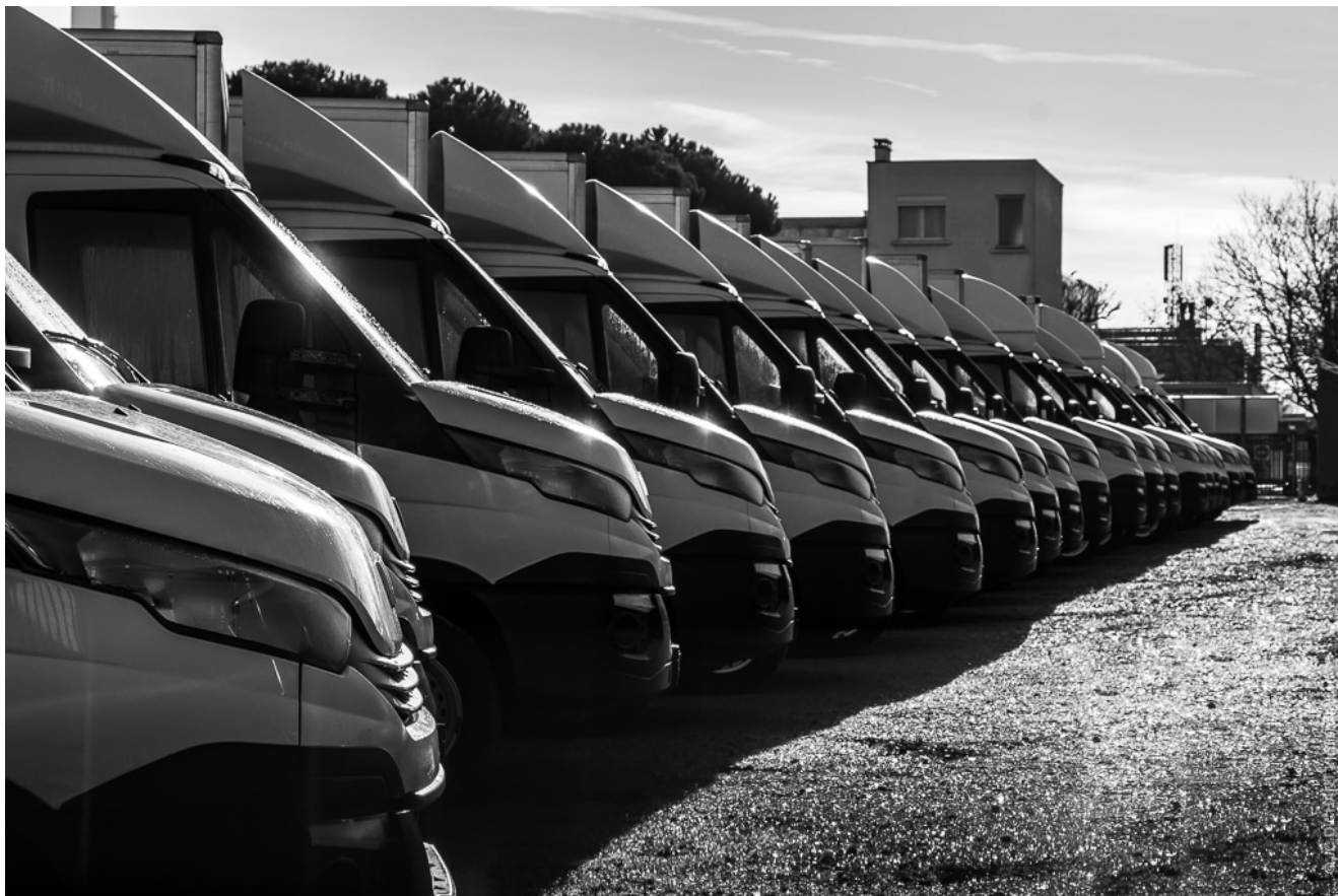
Location d'utilitaires