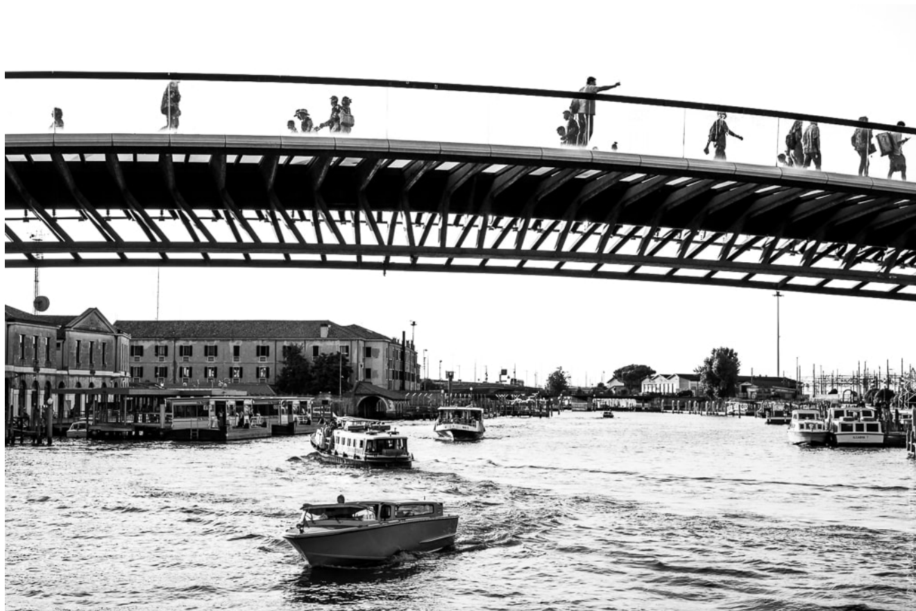
Venise – photo (C) JC Dichant

Depuis l'arrivée du numérique, il n'y a plus de différence de coût entre couleur et noir et blanc. Appareil photo, carte mémoire, logiciel de post-traitement ou tirages, tout est équivalent. Cette démocratisation de la photographie a ouvert de nouvelles possibilités, mais a aussi introduit un nouveau dilemme pour les photographes.