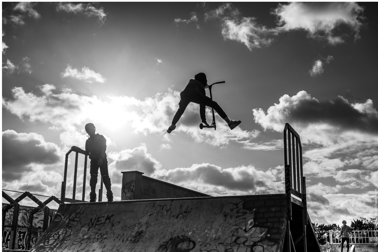
Au skate park