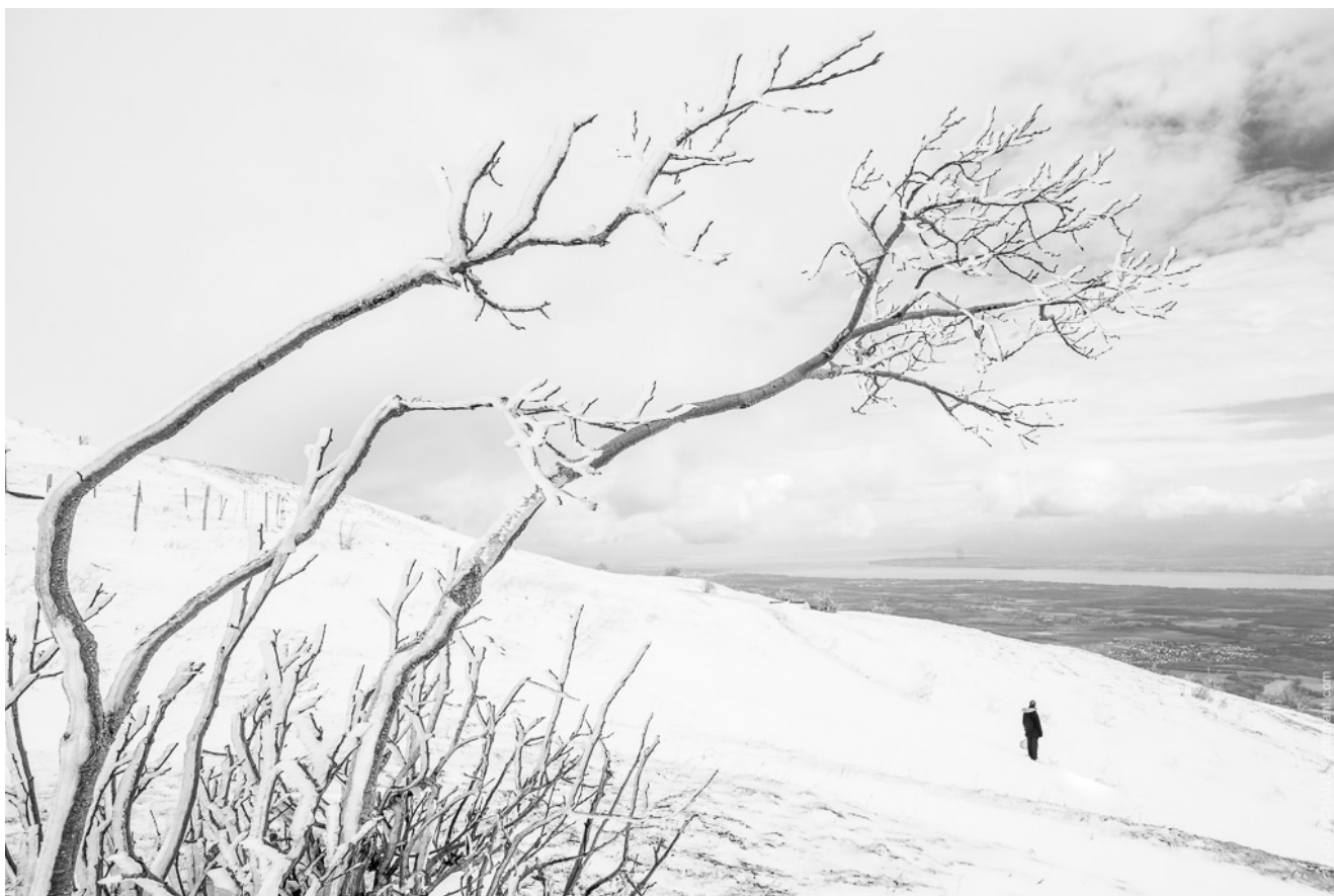
Monts du Jura

sur ce qu'il voit. Le manque de couleur peut permettre au spectateur de mieux rentrer dans l'image. L'expérience émotionnelle est alors plus riche, car le spectateur prend le temps de regarder la photo et non plus de la voir.