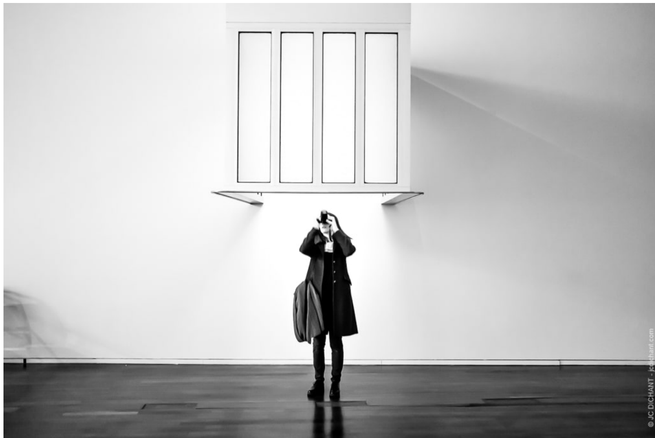
MacVal de Vitry sur Seine