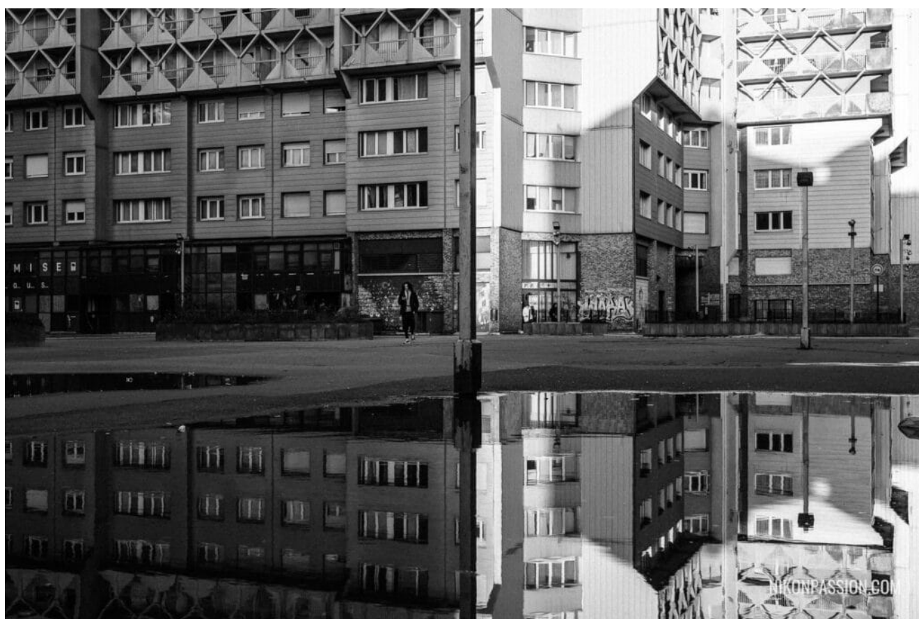
Tour Robespierre - Vitry-sur-Seine - Nikon Z6III + NIKKOR Z 40 mm f/2

sans montrer aucun intérêt. Peu importe, aucune réaction n'est meilleure ou moins bonne qu'une autre. Le simple fait d'avoir lu ces quelques lignes, et de vous poser la question, va vous faire avancer.