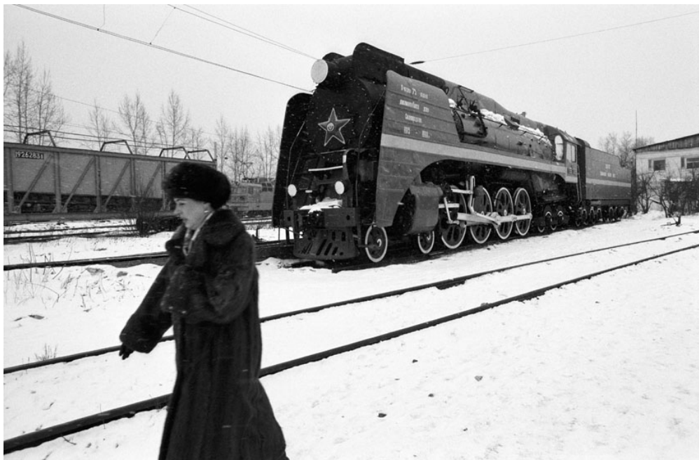
D'anciennes locomotives à vapeur