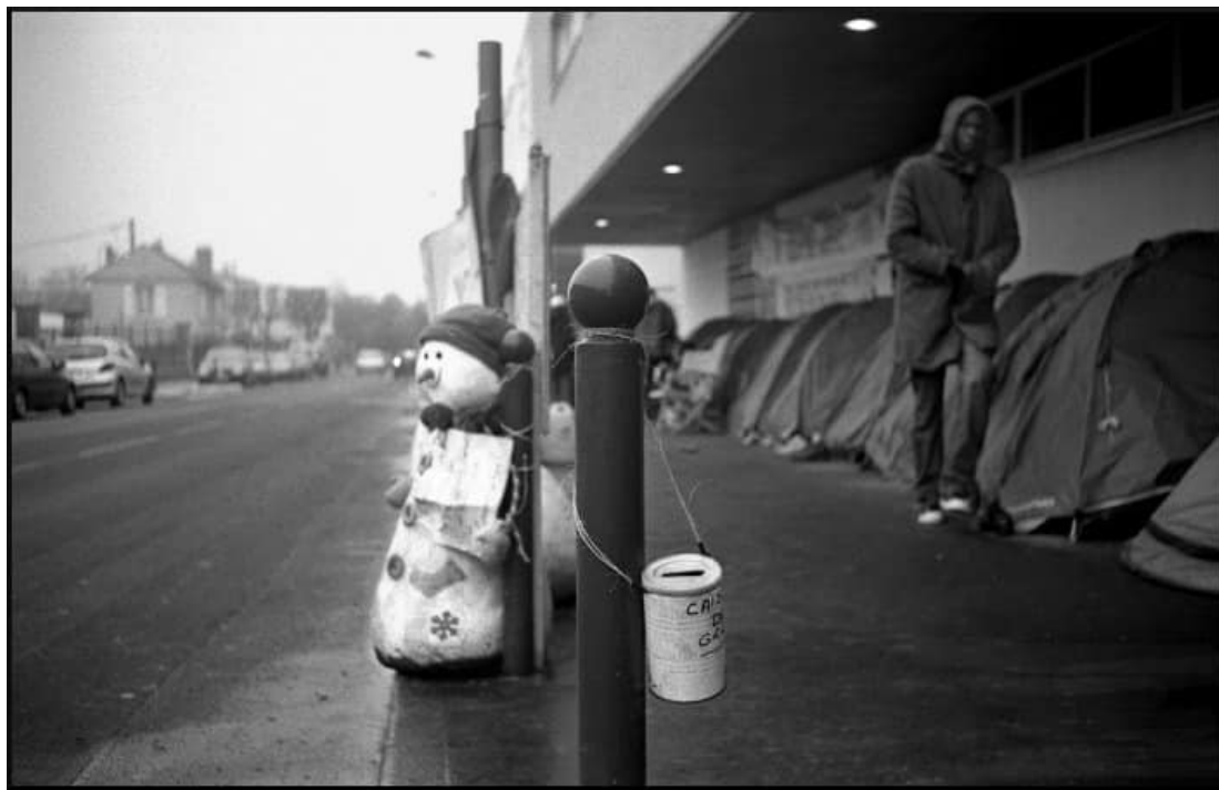
Campement de fortune sous l'hôtel des impôts