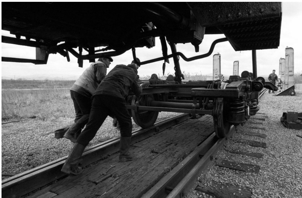
Les techniciens de l'Extrême-Orient

Recevez ma Lettre Photo quotidienne avec des conseils pour faire de meilleures photos : www.nikonpassion.com/newsletter