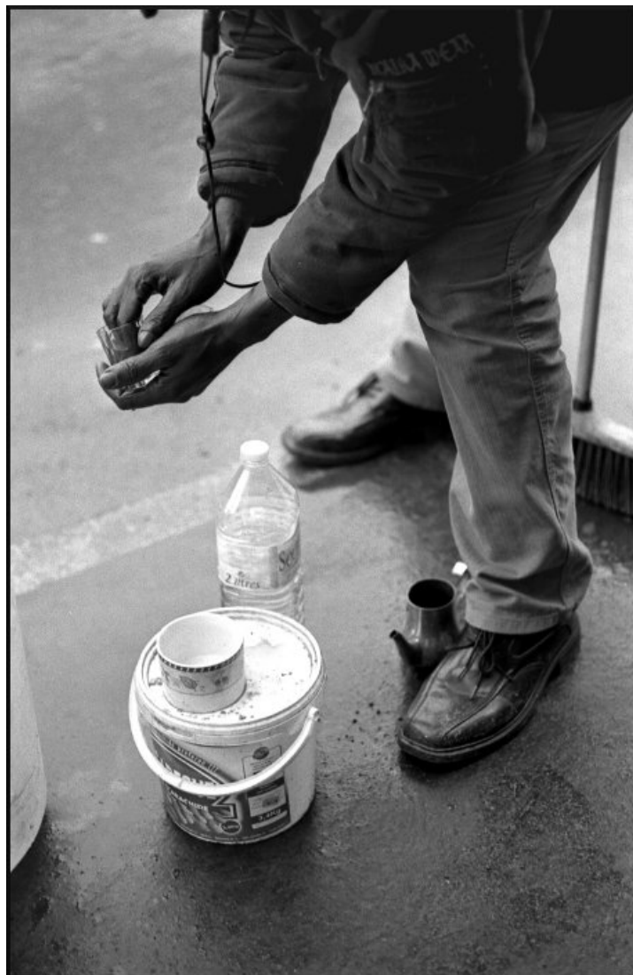
Préparation du petit déjeuner