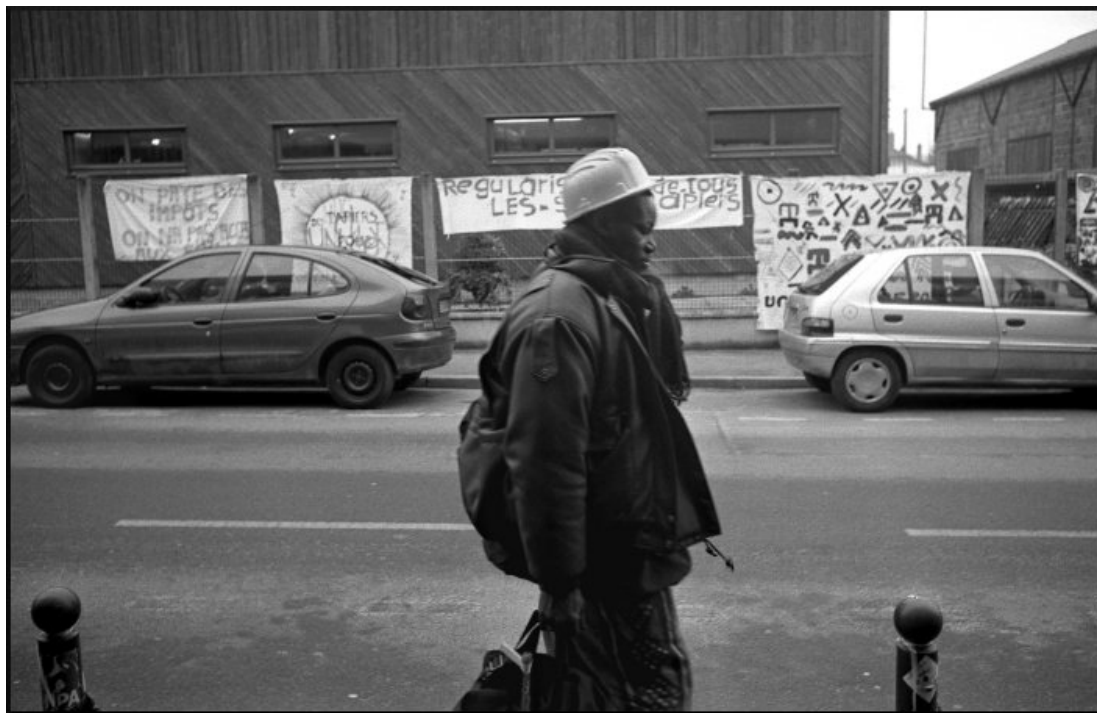
Certains rentrent du boulot ...