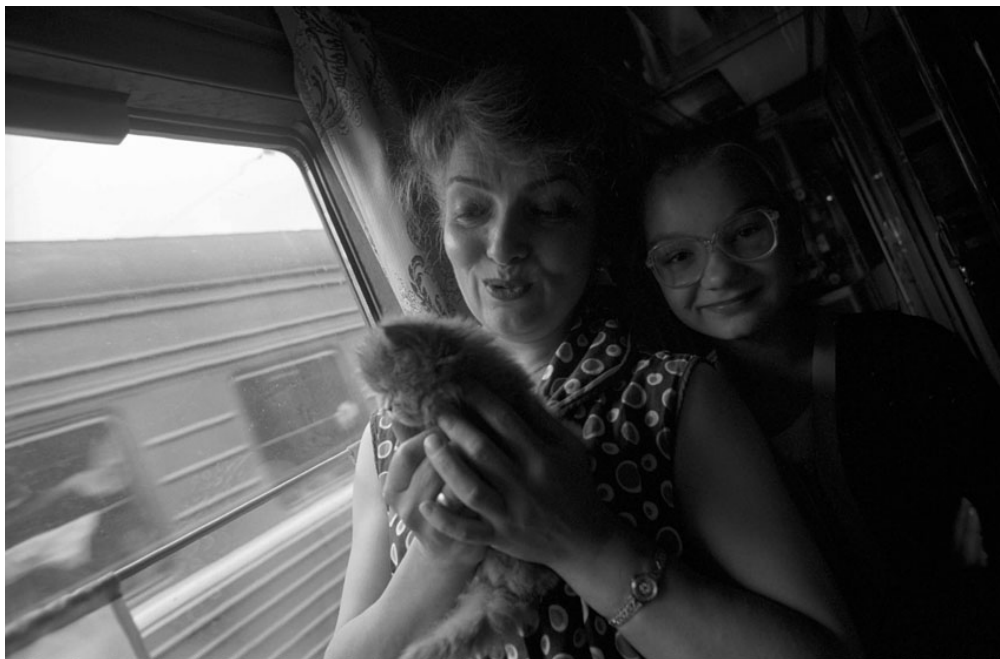
Les compartiments du transsibérien

Recevez ma Lettre Photo quotidienne avec des conseils pour faire de meilleures photos : www.nikonpassion.com/newsletter