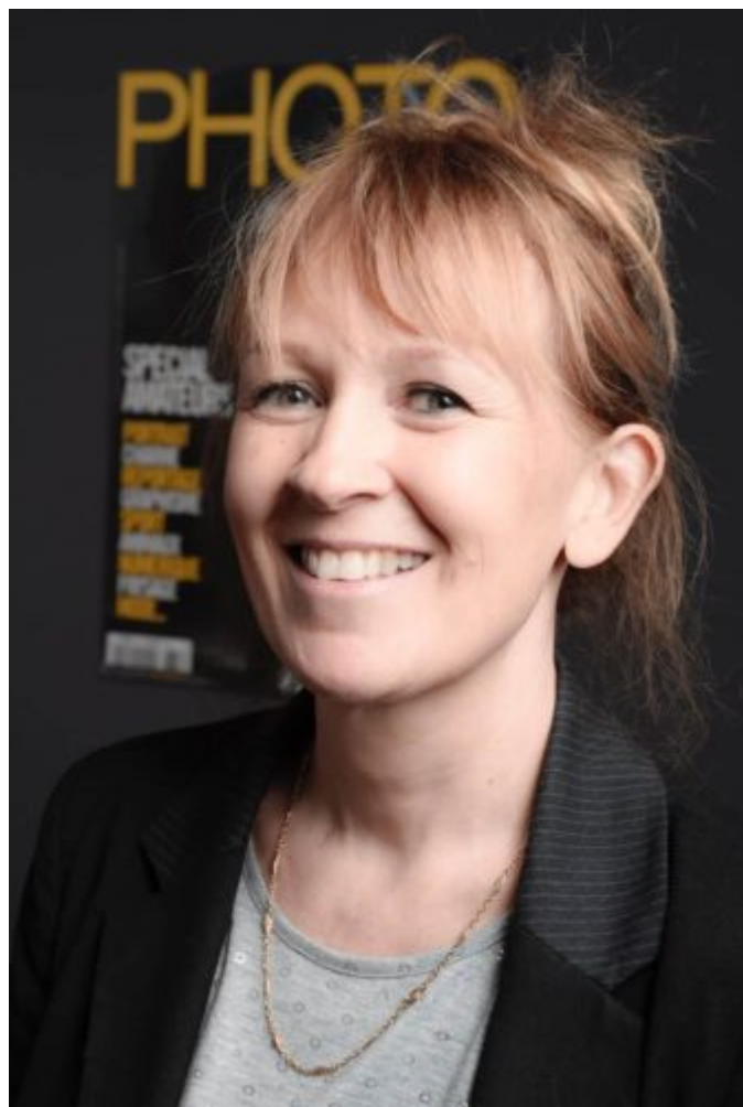
Agnès Grégoire - © Didier Bizos, 2016