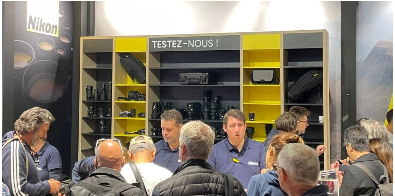
Stand Nikon - Salon de la Photo 2023

Chez Nikon la nouveauté s'appelait Nikon Z f , annoncé quelques jours avant. Autant dire qu'il y avait foule.