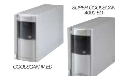
COOLSCAN IV ED