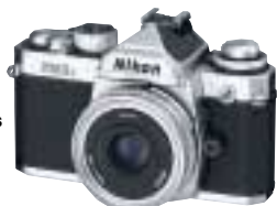
Nikkor 45mm f/2.8 P