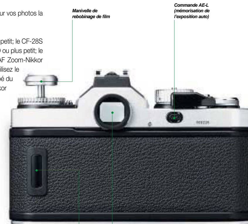
Manivelle de reboinage de film