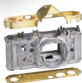
Boîtier moulé sous pression en alliage d'aluminium, de cuivre et de silumin