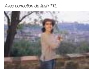
Avec correction de flash TTL

Déclencheur Une légère sollicitation de cette commande active le posomètre intégré.