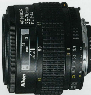
AF Zoom Nikkor 35-70mm f/3,3-4,5