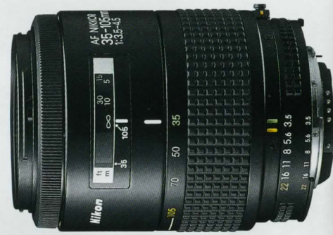
AF Zoom Nikkor 35-105mm f/3,5-4,5*