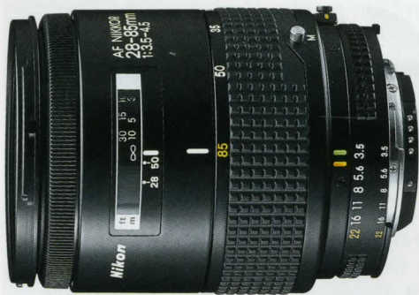
AF Zoom Nikkor 28-85mm f/3,5-4,5*