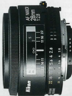
AF Nikkor 28mm f/2,8*