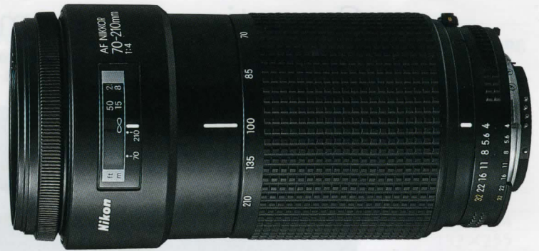
AF Zoom Nikkor 70-210mm f/4