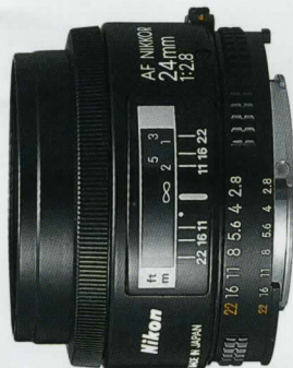
AF Nikkor 24mm f/2,8*