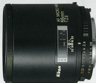
AF Micro Nikkor 55mm f/2,8*