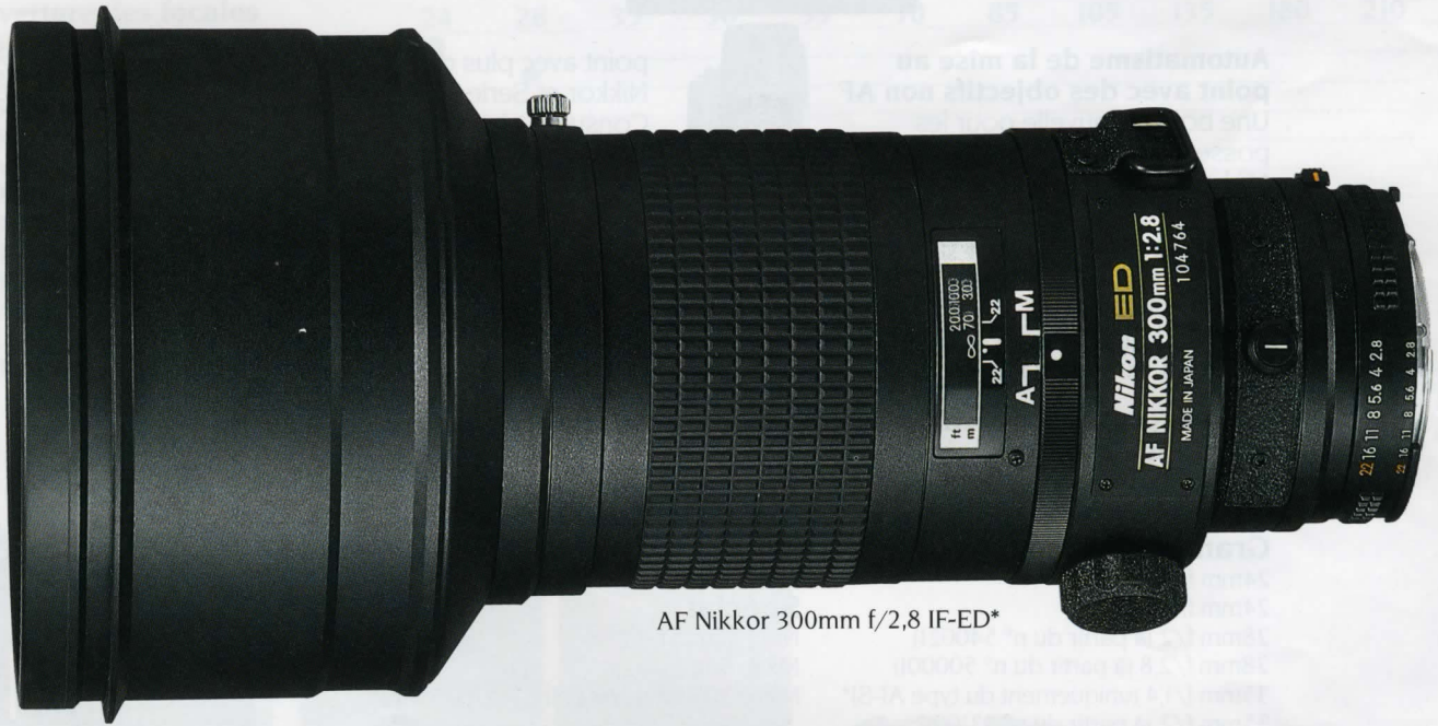
AF Nikkor 300mm f/2,8 IF-ED*