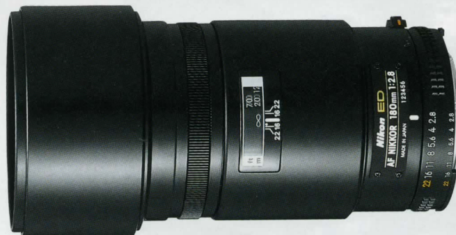
AF Nikkor 180mm f/2,8 IF-ED*