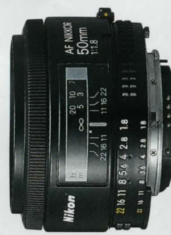
AF Nikkor 50mm f/1,8