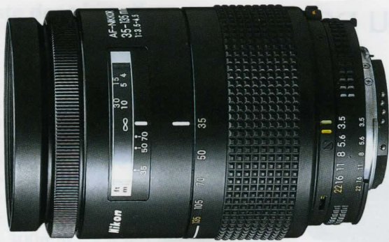
AF Zoom Nikkor 35-135mm f/3,5-4,5*