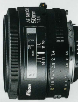
AF Nikkor 50mm f/1,4*