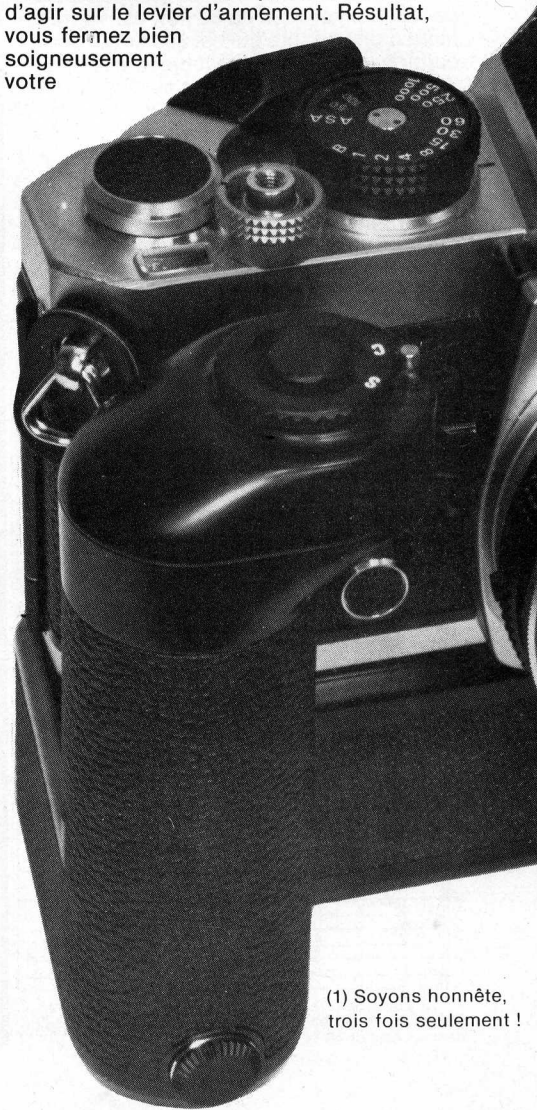
(1) Soyons honnête, trois fois seulement !

positions. C'est un peu imprécis dans la mesure où les crans, de diaphragme en diaphragme sont assez rapprochés. Le système de mesure est alimenté par deux piles à l'oxyde d'argent type Ucar 76. Il est mis en service par le dégagement du levier d'armement de sa position de repos, replié sur le boîtier, à la position de préfonctionnement. Petit — ou gros — inconvénient : oubliez seulement de le remettre en position de repos, le soir avant de coucher votre boîtier bien au chaud et le lendemain matin, vos piles seront mortes. C'est fou ce que consomme une diode minuscule quand elle reste allumée. Cela est encore plus courant quand on utilise le moteur. Dans ce cas-là, la mise sous tension du moteur par le sélecteur « on-off » met aussi la cellule en service sans qu'il soit besoin d'agir sur le levier d'armement. Résultat, vous fermez bien soigneusement votre